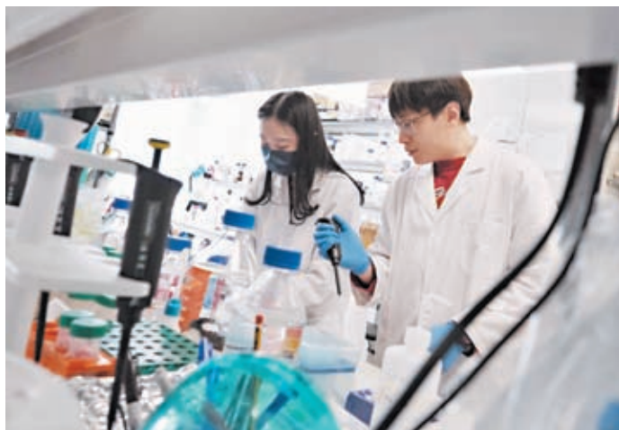
◆新計劃硬性要求投資者最少300萬元投資創科行業。圖為香港創科重點項目之一的生物醫藥科技實驗室。 資料圖片

香港曾在2003年實施「資本投資者入境計劃」，最初投資門檻為650萬元，2010年提升至1,000萬元，同時將買樓剔出資產類別選項。該計劃在2015年停辦。回顧2003年至2015年的12年內，「資本投資者入境計劃」共錄得35,262宗獲批個案，即平均每年約3,000宗。資料顯示，截至2014年底，「資本投資者入境計劃」共吸引資金2,160億元。