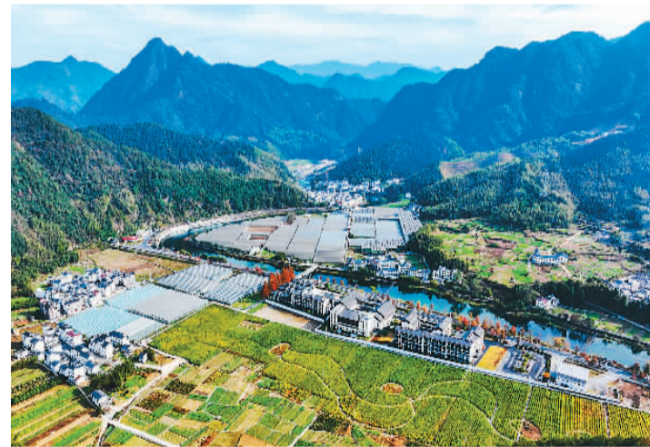
浙江下姜村入选2023年联合国世界旅游组织“最佳旅游乡村”名单,登上世界舞台。图为冬日的下姜村,绿水环绕、青山环抱,风景如画。