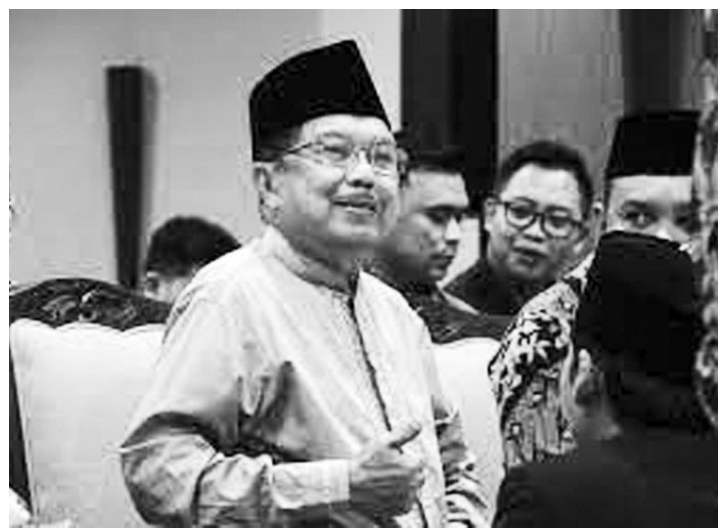
前任副总统尤素夫·卡拉。

卡拉表示，阿尼斯是一位可信度受到考验的领导人；此名前雅京专区省长从未因腐败而被举报。当有人试图将其与电动方程式等腐败案件联系起来时，但最终失败了。在电动方程式中没有出现任何问题。所