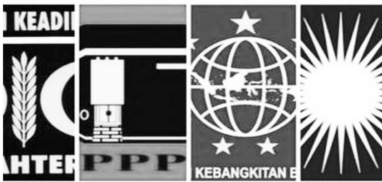
伊斯兰教政党势力逐渐壮大。

年立法选举数据，这三个政党加起来将比印尼斗争民主党还要大。三个政党将产生3000万张选票，即22.42%的选票，而印尼斗争民主党作为最大政党才获得19.91%选票。