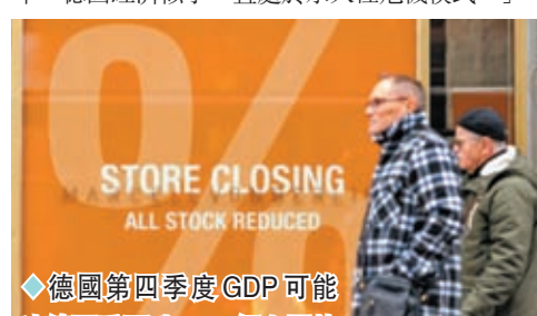
德國第四季度GDP可能連續兩季下跌。網上圖片

國際金融服務企業荷蘭國際集團(ING)全球宏觀經濟主管布熱斯基總結稱，供應鏈摩擦、能源危機、通脹攀升、貨幣緊縮政策和結構性缺陷，都是德國經濟面臨的挑戰，「今年又是動盪的一年，德國經濟似乎一直處於永久性危機模式。」