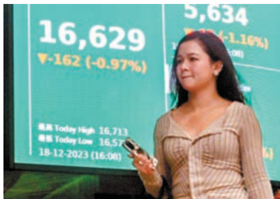
◆港股18日跌162點，成交縮減至943億港元。

恒指18日收16,629點，跌162點或1%，大市成交縮減至943億元。科指收報3,730點，跌約1%。信義光能及中國生物製藥挫逾5%，成表現最差兩隻藍籌。紅海危機下，憧憬貨櫃船費向上，部分航運股急升，海豐國際升逾14%，中遠海能、中遠海控升逾6%及逾7%，東方海外國際升4%，成表現最佳藍籌。