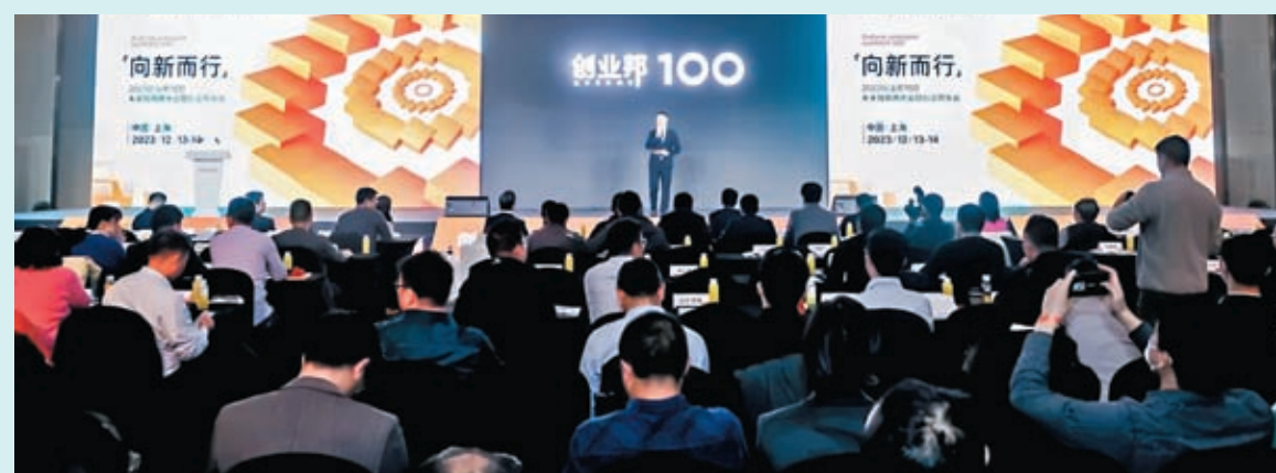
◆創業邦發布100未來獨角獸榜單。