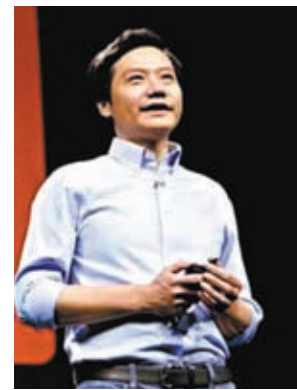
◆雷軍表示，小米第一輛車的研發投入，是普通車企的「十倍投入」。

香港文匯報訊（記者 周曉菁）小米造車有新進展。創始人、董事長兼首席執行官雷軍接受央視訪問時透露，小米的第一輛車，投入了3,400名工程師，研發投入超過100億元（人民幣，下同）。與普通車企相比，是「十倍投入」原則，正常一輛車大概投入三四百人，研發經費在10億至20億元。