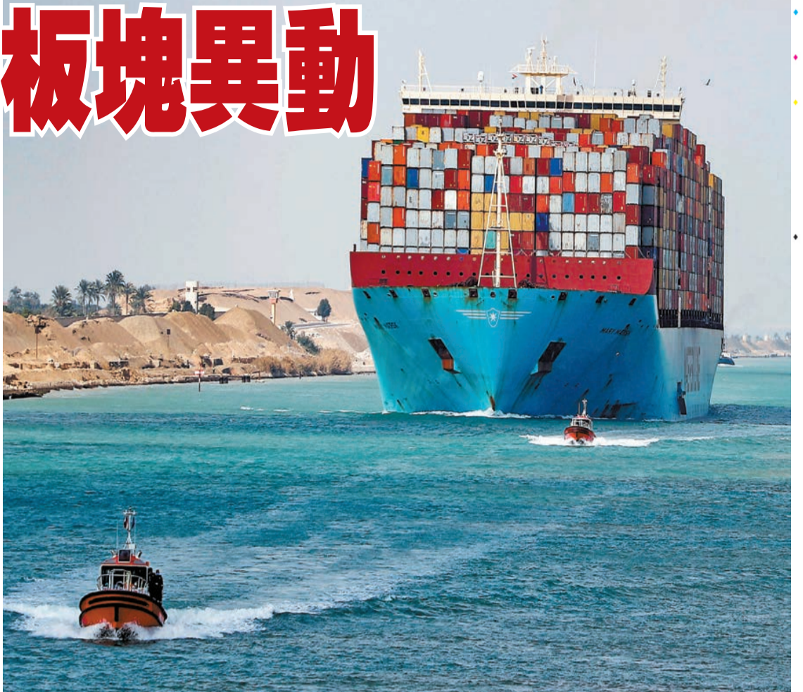
紅海是經蘇伊士運河運輸的必經之路，這條航線的關閉將導致貿易成本大幅上升，甚至擾亂全球供應鏈。