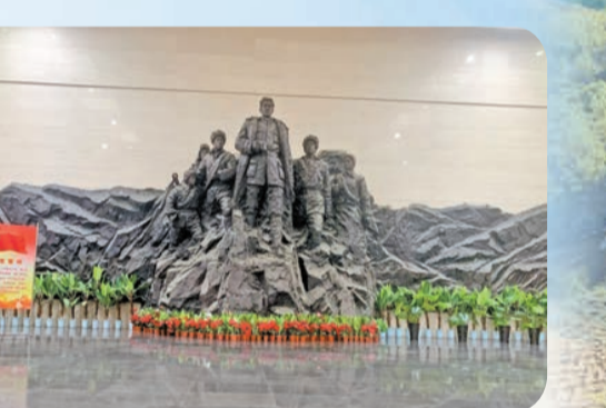
趙尚志紀念館序廳

趙尚志紀念館位於遼寧省朝陽市市區，佔地面積20000平方米，建築面積6000平方米，布展面積4000平方米。紀念館總體設計以弘揚尚志精神為主題，以將軍革命戰鬥的一生為主線，突出展現了抗日民族英雄趙尚志的精神實質和光輝業績。紀念館館名由原國家軍委副主席、國防部長遲浩田題寫。在展陳中利用幻影成像、半景畫以及聲光電等手段，重點對顛覆日軍軍列、木炮打賓州、冰趟子戰鬥和最後的戰鬥等重要戰役進行詳細解讀，再現了趙尚志誓死抗日、堅貞不屈的光輝形象和鬥爭精神。