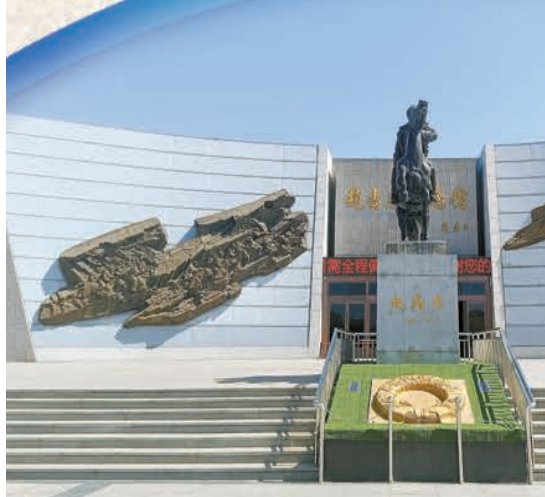
趙尚志紀念館正門

字，由原中央軍委副主席張萬年上將題寫；紀念碑題字「趙尚志烈士永垂不朽」，由原中央軍委副主席、國防部長遲浩田上將題寫；位於紀念堂中心的半地下室內，安葬著趙尚志將軍的顛骨。