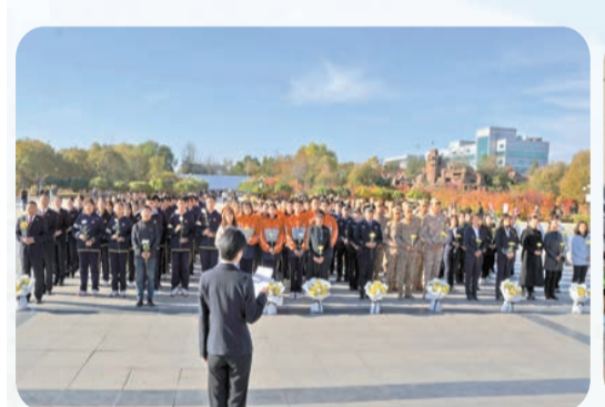
社會各界在趙尚志紀念館接受愛國主義教育