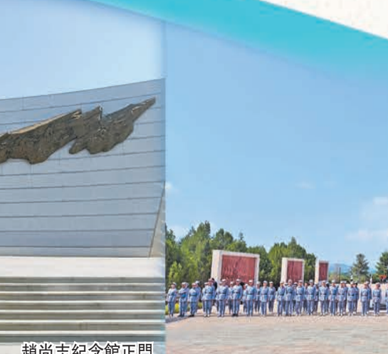
趙尚志烈士陵園紀念碑