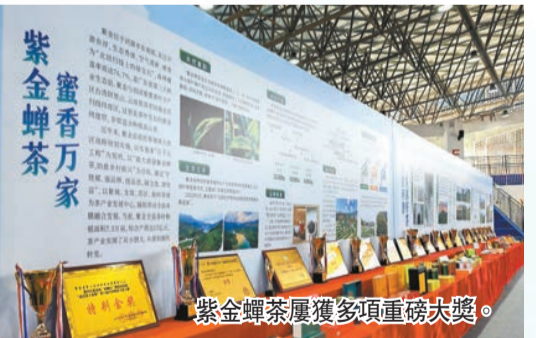
紫金蟬茶屢獲多項重磅大獎。