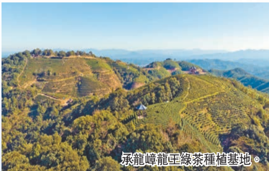
承龍嶺龍王綠茶種植基地。