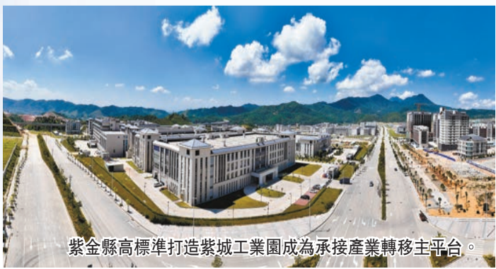
紫金縣高標準打造紫城工業園成為承接產業轉移主平台。

為產業有序落地提供載體。工業園在發展中探索「雙向飛地」新模式，推動產業有序轉移。為增強現代產業發展後勁，紫金縣健全完善「3+16+21」招商工作機制，匯聚3支招商小分隊、16個鎮、21名招商大使的招商合力，招商引資活力持續迸發，經濟「蛋糕」不斷做大。截至目前，兩大園區累計引進項目96個，合同總投資達572.92億元，新材料、新製造產業加快向百億級邁進。值得一提的是，今年上半年，紫金全縣完成地區生產總值66.39億元、同比增長6%，增速高於全國、全省和全市平均水平；規上工業增加值14.73億元，同比增17.2%，增速排名全市第一，發展勢頭強勁。數據的背後，檢驗了「工業立縣、農業強縣、旅遊旺縣」思路的成效，在發展過程中，紫金推動工業、農業、旅遊三大產業齊頭並進、融合發展，全縣經濟運行保持向上向好發展態勢。