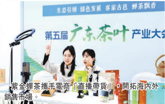
紫金蟬茶攜手電商「直播帶貨」，開拓海內外銷售市場。