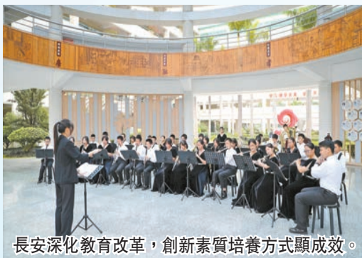
長安深化教育改革，創新素質培養方式顯成效。

此外，長安鎮還積極打造「思政+」思政課程體系，從愛黨、愛國、愛家鄉、愛校、愛生五個維度構建「思政+」大思政課程體系，2022年，組織「航天夢 強國夢 長安夢」六個系列活動，引起20萬人次關注。打造「最潮」勞動教育，提出了「我勞動 我最潮」的勞動教育口號，搭建三大課程包括：品智生活，我領潮——生活勞動課程；產教啓蒙，我弄潮——生產勞動課程；公益服務，我立潮——服務性勞動課程，在每年5月舉辦勞動教育特色月活動。打造「最炫」科技教育，通過「1248N」科學教育行動計劃，推動最「炫」團隊、最「炫」課程、最「炫」人才、最「炫」活動和最「炫」基地等五個方面建設工作。