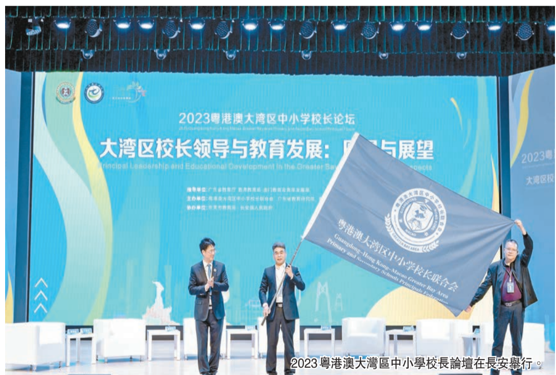
2023粵港澳大灣區中小學校長論壇在長安舉行。

日前，長安鎮小學生「課間十分鐘」運動及做遊戲的畫面登上央視視屏。下課鈴聲響後，長安鎮中心小學的同學們從教室魚貫而出，在開闊的室外自在玩耍，或是丟手絹、跳繩，或是玩「編花籃」「剪刀石頭布」等遊戲，校園裏歡笑聲不斷。 長安鎮中心小學師生共同打造了課間趣味遊戲庫，全校徵集100個有趣又安全的小遊戲，鼓勵大家對傳統遊戲進行創新改編，充分調動學生參與課間活動的積極性。當下如何給中小學生減負、快樂學習成爲熱點話題，長安鎮通過師生共創趣味遊戲庫，把「課間十分鐘」還給孩子僅是長安教育改革、創新培養的一個生動縮影。 當前，長安鎮承擔推進3項省級教育改革項目，分別是廣東省基礎教育教研基地、廣東省「三全育人」體制機制建設實驗區、廣東省學前教育高質量