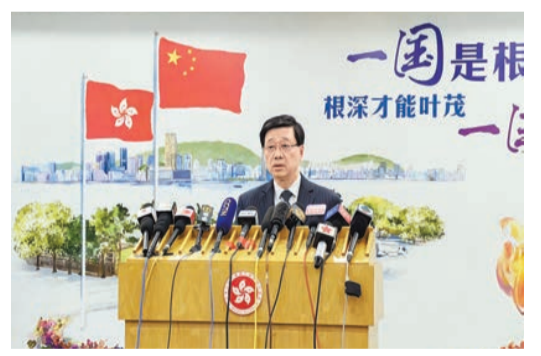
李家超在北京向國家主席習近平述職後會見傳媒。

第四，特區政府會建立安全穩定的社會環境，並全力發展經濟、改善民生。今次報告了《施政報告》內一系列「搶人才、搶企業」政策及成績，以及照顧市民福祉、加快建屋造地、保障勞工、扶老、助弱等措施。