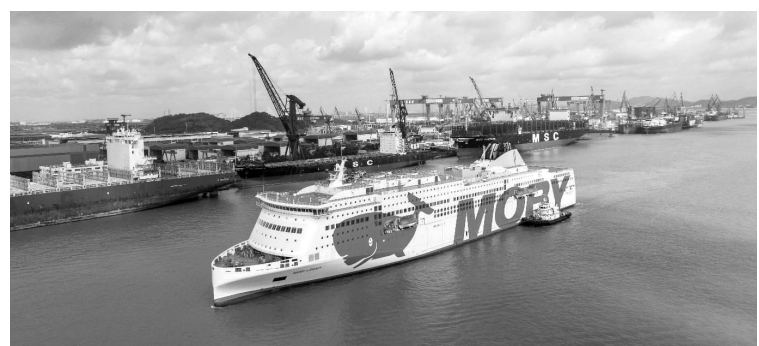
2023年7月7日,试航中的“MOBY LEGACY(莫比·雷格斯)”号轮。

“MOBY LEGACY”号轮船长237米,型宽33米,服务航速约23.5节,共有13