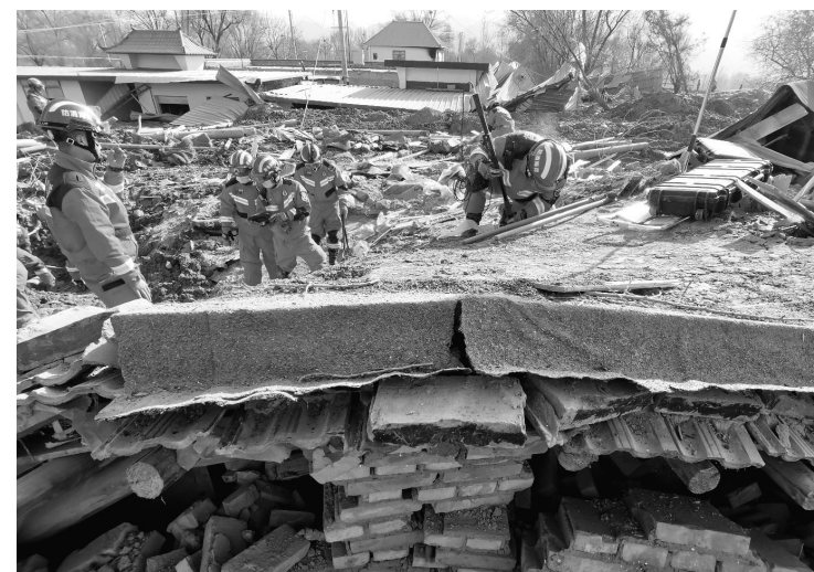
12月19日,救援人员在青海省民和县中川乡美一村进行救援。

新华社北京12月19日电 甘肃临夏州积石山县发生6.2级地震后,解放军和武警部队19日凌晨起出动多支救援力量抵达地震灾区,展开抗震救灾。