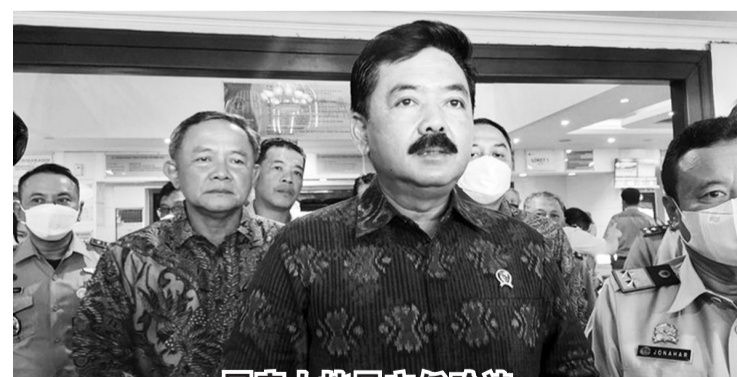
国家土地局主任哈迪。

【本报讯】土地与空间规划部长/国家土地局局长哈迪表示，将全力以赴消除土地黑手党。11月23日，在向东爪哇，巴都市(Batu)，Sumberbrantas村分发土地重新分配证书时透露了这一点。哈迪部长指出，2023年，针对土地黑手党的执法力度有所增加，这是执法人员的