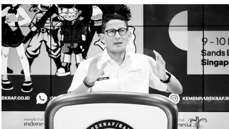
旅游与创意经济部长善迪亚卡。

【本报讯】12月18日，旅游与创意经济部长善迪亚卡呼吁民众在进行活动时，始终佩戴口罩，包括在2023年