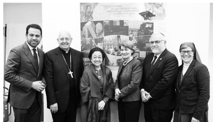
我国第五任总统梅加瓦蒂(左三)。

持宗教团体之间宽容的价值。此外，我国是世界上最大的穆斯林国家。我国由各种宗教组成，尽管是一个最大的穆斯林国家，但我们也实行宽容。教宗方济各表示，这一切必须得到维护，我们都必须保持世界上存在的宗教宽容与和平。在会晤中，没有讨论政治。我们不谈论政治，我们谈论我们如何共同努力维护和平。(亮剑)