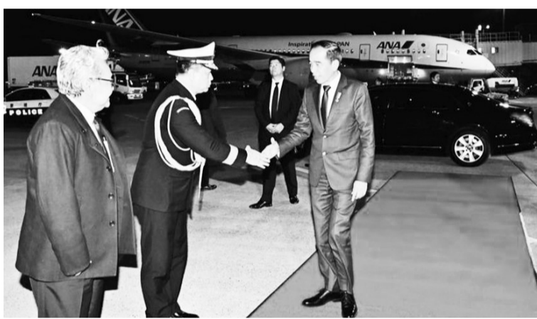
佐科维总统返抵国门。

【本报讯】佐科维总统及随行人员于12月17日东京时间19:30左右飞回雅加达。根据总统府秘书处的新闻稿报道，国家元首乘坐印度尼西亚总统一号专机通过日本东京羽田国际机场起飞。日本高级外交官靖正树大使、