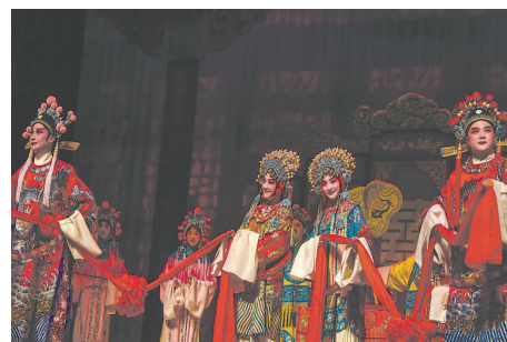
黄梅戏《女驸马》剧照。

《女驸马》被誉为安徽省黄梅戏剧院的“看家大戏”,讲述了冯素珍冒死救夫,经历种种曲折,终于如愿以偿,成就美满姻缘的故事,几十年来常演不衰。该剧曾获得巴黎中国戏曲节“评委会特别奖”、澳大利亚多元文化节“最佳戏剧奖”。安徽省黄梅戏剧院国家一级演员、中国戏剧“梅花奖”获得者孙娟领衔主