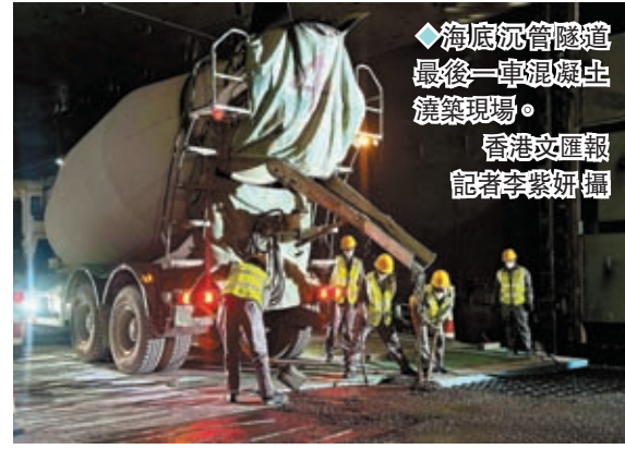
◆海底沉管隧道最後一車混凝土澆築現場。