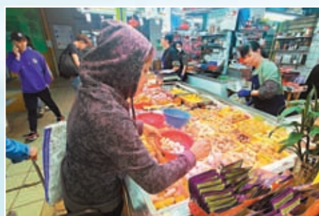
◆天寒地凍，街市火鍋食材搶手。