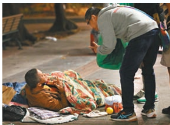
◆義工探望寒夜中的無家可歸者。