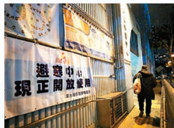
◆有疑似露宿者帶齊自己「家當」進入避寒中心。