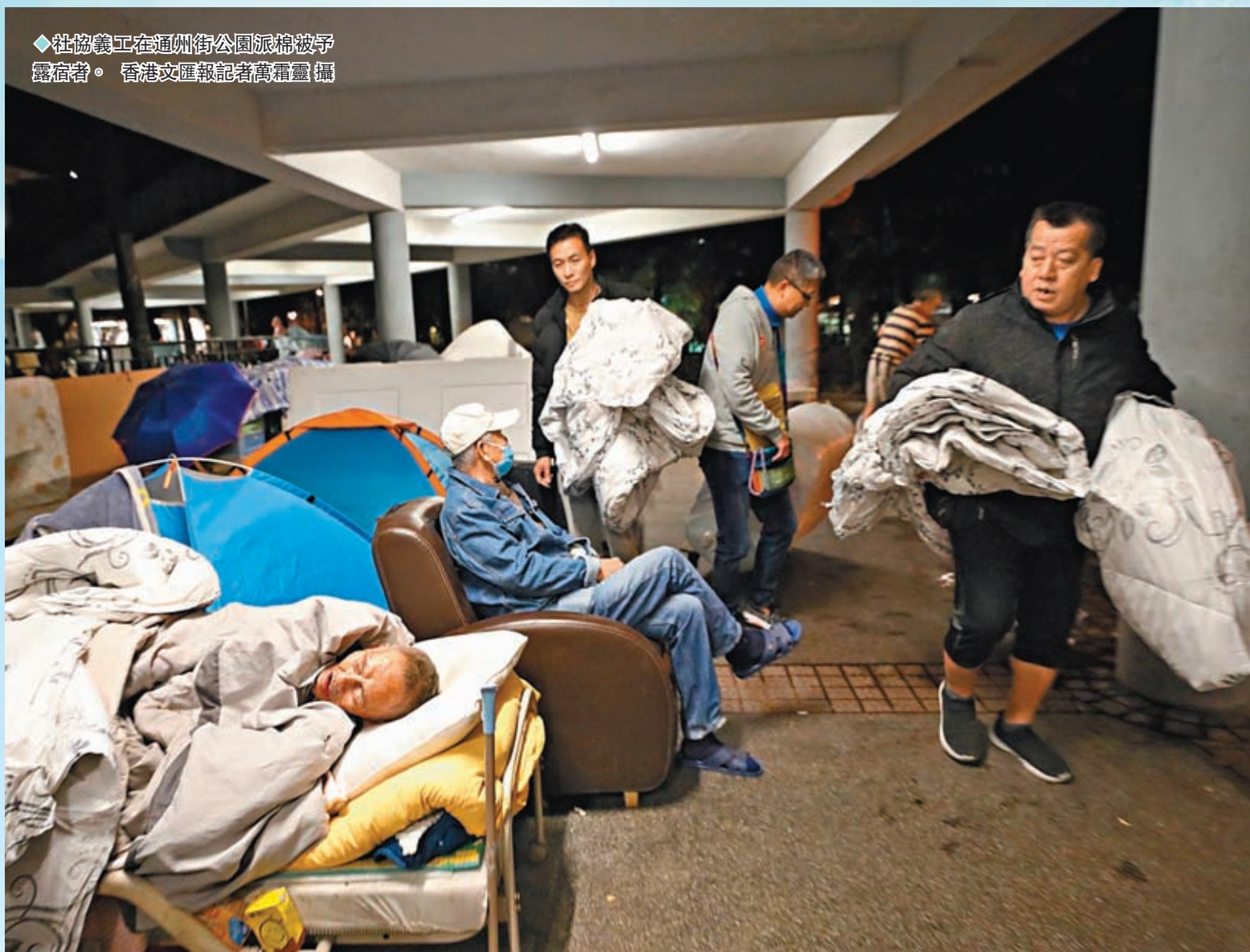
◆社協義工在通州街公園派棉被予露宿者。

香港天文台於16日清晨6時發出寒冷天氣警告及強烈季候風信號。長者安居協會由16日凌晨至清晨6時共收到64人次使用協會「一線通平安鐘」服務，其中11人需要送院接受治療，主要原因包括心臟不適及血壓問題。