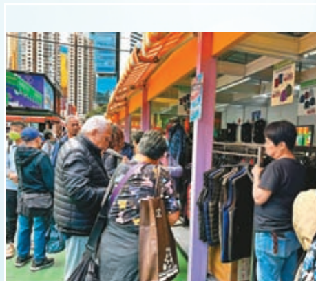
◆16日工展會上，羽絨背心等禦寒衣物大賣。