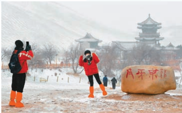
◆在旅遊優惠政策及獨特冰雪景觀吸引下，「冬遊」絲路受到越來越多遊客的青睞。圖為12月14日，遊客在甘肅省敦煌市鳴沙山月牙泉景區拍照。

據中央氣象台預測，受冷空氣影響，16日至18日，貴州中北部和東部、湖南西部和南部等