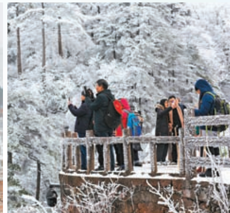
◆受寒潮天氣影響，安徽省黃山風景區迎來今冬首場降雪。圖為12月16日，遊客在黃山風景區欣賞雪景。