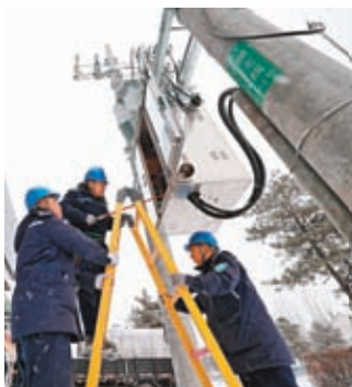
◆12月15日，吉林省延邊朝鮮族自治州延吉市，國家電網某供電公司工作人員冒着大雪對供電設備進行搶修。

內蒙古準格爾旗在戶外放置了52座清潔工休息亭，並配備了電暖氣、座椅、熱水壺、充電插座等，解決了700