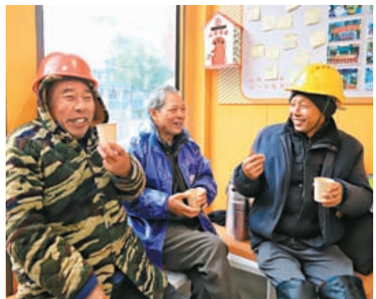
◆12月16日，幾名戶外勞動者在位於浙江舟山市的一家「勞動者驛站」裏喝薑茶驅寒。

零下5攝氏度的寒風中，清潔工人在河南省鄭州市紫荊山立交橋附近除冰、清掃垃圾，幹完活便在旁邊的一個戶外勞動者驛站吃飯、休息，這裏空調開得很足，還備有燒開的冰糖雪梨水、藥物等。據介紹，鄭州市金水區擁有8所戶外勞動者驛站、43個環衛驛站，都可以供清潔工人休息。