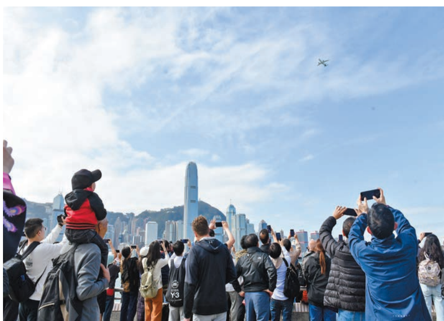
大批市民和遊客在維港兩岸觀看C919飛行秀。

【香港商報訊】記者戴合聲報道：中國自主研製客機C919昨早飛越維港上空，作飛行演示，吸引大批市民和遊客在維港兩岸觀看，不少攝影發燒友及「飛機迷」更是架設了「長槍短炮」，希望拍攝C919進入維港上空一刻的歷史瞬間。