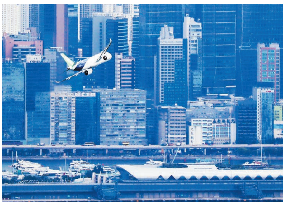
C919飛臨過去的機場、今日的啓德郵輪碼頭上空。