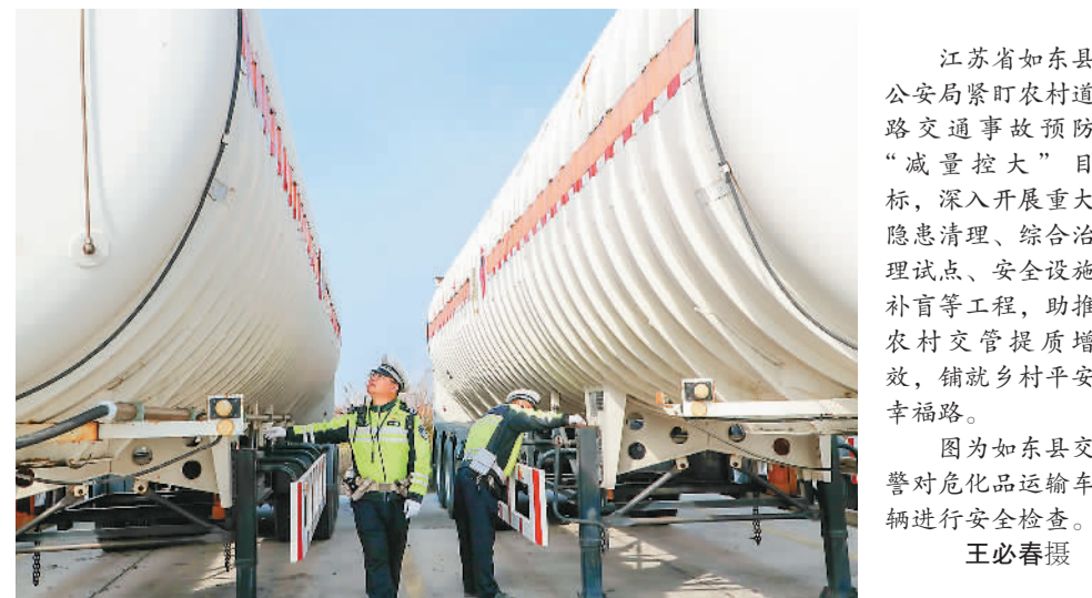
江苏省如东县公安局紧盯农村道路交通事故预防“减量控大”目标，深入开展重大隐患排查、综合治理试点、安全设施补盲等工程，助推农村交管提质增效，铺就乡村平安幸福路。 图为如东县交警大队对危化品运输车辆进行安全检查。

截至2022年，国家知识产权局已支持京津冀三地培育国家知识产权示范企业132家、优势企业491家，打造出一批知识产权运用能力强、转化效益高的企业标杆。