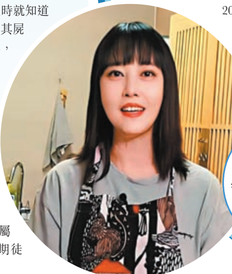
周海媚生前時常於社交平台與網友交流廚藝。

「洩露者必然要承擔相應的法律責任。」北京市聚信律師事務所的律師何志鵬對香港文匯報表示，《中華人民共和國治安管理處罰法》對洩露公民信息行為有明確條款規定與罰則。如果洩露信息的是醫務人員，除追究法律責任之外，主管部門還可以根據《民法典》相關規定追究其部門行政責任，一旦相關行為被查證屬實，相關責任人將面臨最高7年的有期徒刑。