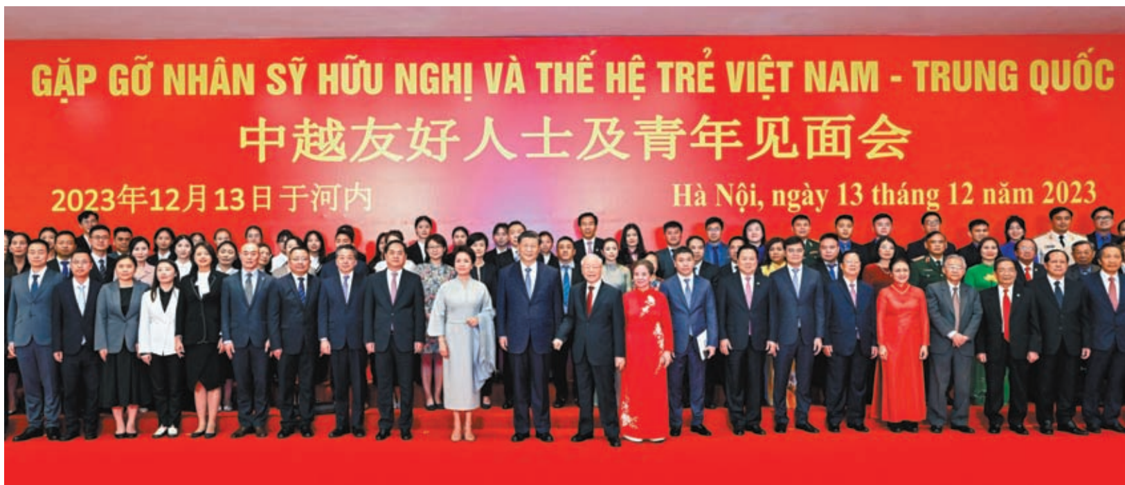
◆當地時間12月13日下午，中共中央總書記、國家主席習近平和夫人彭麗媛在河內同越共中央總書記阮富仲夫婦共同會見中越兩國青年和友好人士代表。這是習近平夫婦和阮富仲夫婦同中越兩國青年和友好人士代表親切合影。