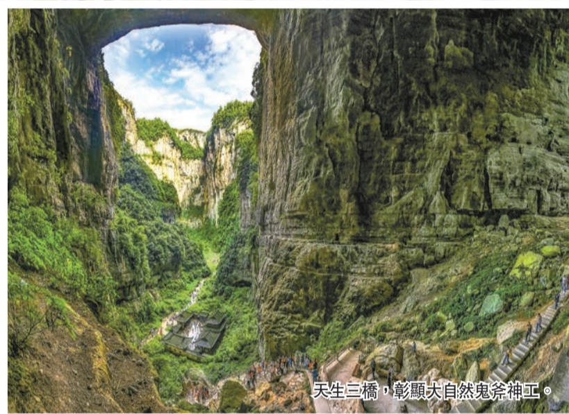
天生三橋，彰顯大自然鬼斧神工。