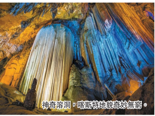
神奇溶洞，喀斯特地貌高妙無窮。

趁着旅遊國際化發展大潮，中國各地的旅遊城市加速「出海」。重慶武隆，以「中國唯一，世界獨有」天生三橋、「南國第一牧場」仙女山、「地球最美裂縫」龍水峽地縫等景區景點，以及「世界自然遺產」「國家5A級旅遊景區」「國家級旅遊度假區」「國家全域旅遊示範區」「世界最佳旅遊鄉村」等七塊金字招牌，勇立潮頭！