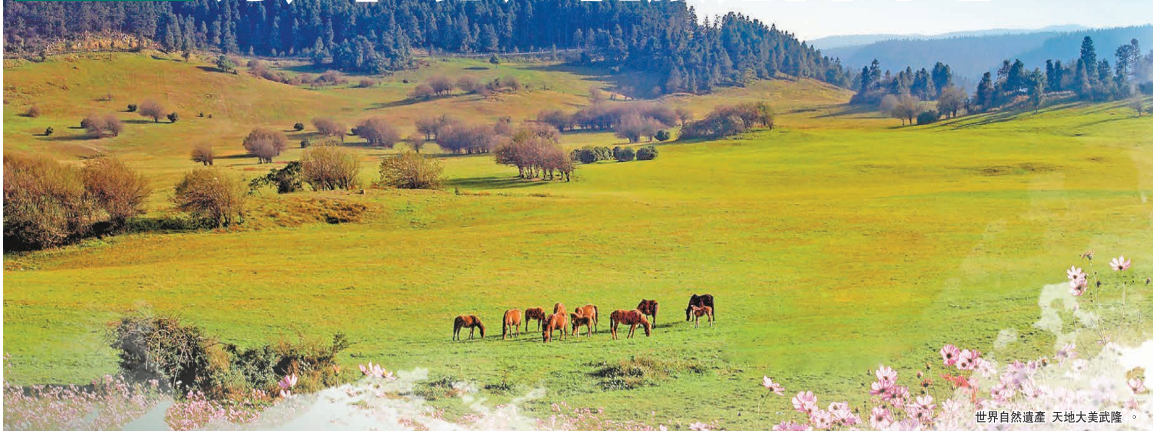
世界自然遺產 天地大美武隆。

當今世界，全球旅遊業已進入國際化發展的新時代，並成為增長速度最快的行業之一。中國是世界第一大出境客源地和第四大入境目的地國家，國際化進程不斷加快。今年一季度，中國旅行社入境旅遊外聯1.92萬人次、6.92萬人天；出境旅遊組織31.86萬人次、141.95萬人天，成為影響全球旅遊版圖的重要力量。