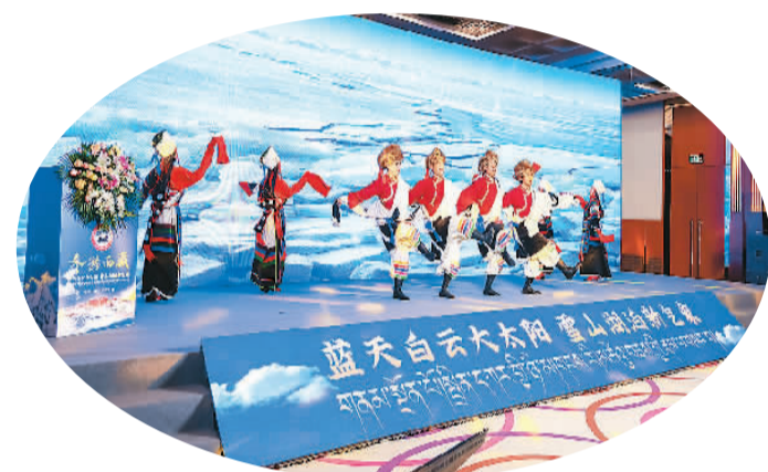
2023年冬季西藏旅游营销推介会上的藏族舞蹈表演。

本报电(一宁)近日，由西藏自治区旅游发展厅主办的2023年冬季西藏旅游营销推介会在北京举办。推介会以“蓝天白云大太阳·雪山湖泊新气象”为主题，展示独特的西藏文化和绝美的山水资源，受到旅游业界和游客的关注。