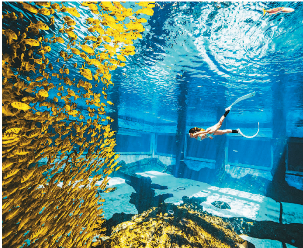
游客在三亚海昌梦幻海洋不夜城的小黄鱼潜水体验馆潜水。

马蜂窝创始人、CEO陈罡介绍，2023年定制游搜索热度同比增长245%，高品质需求热度持续攀升，高性价比产品预订显著增长，这意味着目的地旅行体验成为影响游客决策的主要因素。