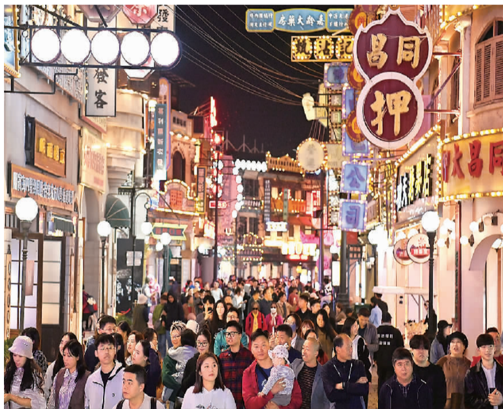
浙江省横店影视城广州街、香港街景区灯火通明，众多游客前来体验大型行进式演艺秀《走进电影》，感受电影拍摄的全过程。

目前，淳安县农旅融合不断发展，今年已吸引30多万游客到乡村旅游休闲度假，产业创收达9400万元，成为长三角热门的旅游目的地。