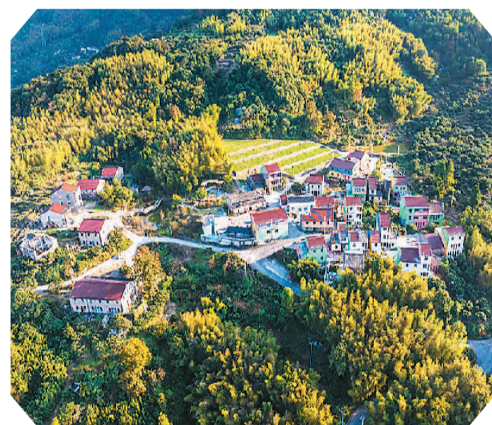
浙江省临海市汛桥镇自然风光优美，文化底蕴深厚，有中华道家文化发祥地盖竹山、道教第十九洞天、第二福地盖竹洞和葛仙翁植茶遗址。当地依托良好的自然生态和人文资源，加速人才、资金、技术、信息等要素的流动，加快“临海·溪山有道”片区共富项目建设，整合沿阮家洋溪5个村现有资源，以旅居、颐养、度假为核心，多措并举推动乡村旅游发展，让“好风景”转化为“好钱景”。

会上还重点推介了藏历新年、西藏味道、星空、天湖、观山等西藏冬季系列产品。此外，为给广大游客提供优质的旅游体验，除寺庙景区外，西藏自治区内所有A级景区(包含布达拉宫)均免费游览，三星级及以上宾馆、饭店及国际品牌酒店、精品酒店执行淡季价格。