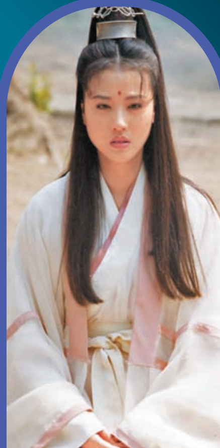
◆周海媚獲封「最美周芷若」。