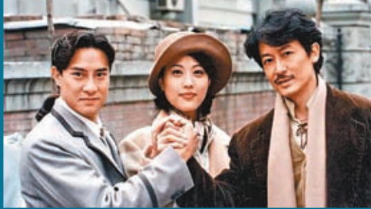
◆周海媚曾主演陳動奇執導的劇集《上海探戈》。