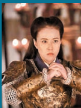
◆周海媚曾飾演《楊門女將》。

美人自古如名將，不許人間見白頭。香港女星周海媚於12月11日離世，享年57歲。她的工作室12日晚發出聲明：「海媚姐因病醫治無效，於2023年12月11日離開了我們。願天堂沒有疾病，願來生我們再相識！」瘋傳1天的噩耗不幸被證實。前東家無線電視12日晚亦發悼文，稱「好戲之人離世，實在值得觀眾永遠懷念！」