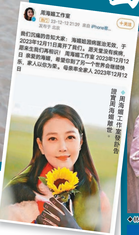
◆周海媚工作室發訃告證實周海媚離世。