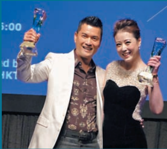
◆2015年，周海媚和前夫呂良偉齊獲「英藝獎」。