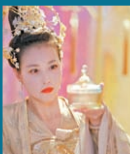
◆周海媚在內地熱播劇《香蜜沉沉燼如霜》中飾天后。