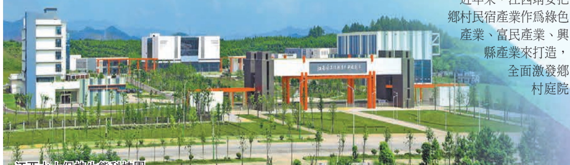
江西水土保持生態科技園