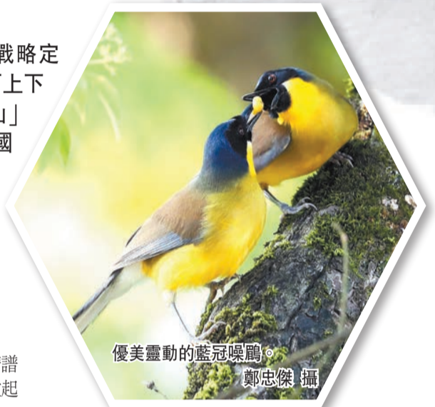
優美靈動的藍冠噪鵲。