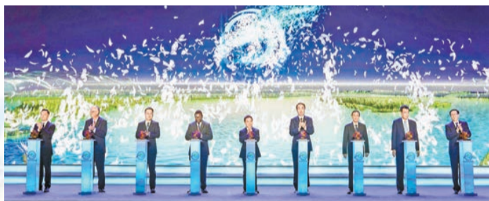
第三屆鄱陽湖國際觀鳥季在吳城候鳥小鎮開幕。

近年來，江西始終堅持把加強野生動物資源保護作為推進生態文明建設的重要內容，不斷健全完善野生動物