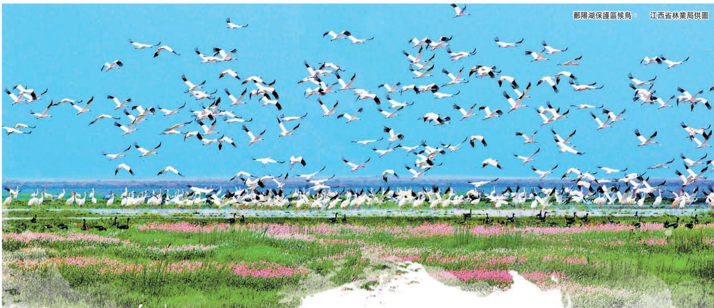
鄱陽湖保護區候鳥。