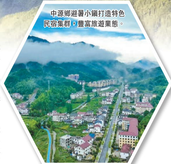
中源鄉避暑小鎮打造特色民宿集群，豐富旅遊業態。