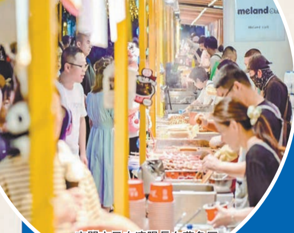
夜間市民在瀋陽長白萬象匯島上市集品嘗美食。

同時，為了保障消費者在「夜經濟」街區、場景中的舒適體驗，瀋陽市還在加強了夜市申辦規範流程及負面清單。瀋陽區市場監管部門通過加大日常巡查頻次，督促指導市場主辦方和經營者落實主體責任、守法誠信經營，及時發現並消除食品安全風險隱患。鐵西區多部門聯動，加強市場監管、城市管理部門協同服務，提升消費體驗。針對夜經濟消費街區街面停車的問題，進一步優化停車位管理，並加密公共交通夜間運行班次，延長夜間運營時間。