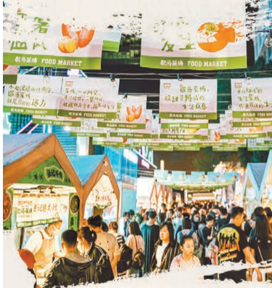
由香港設計團隊總體規劃設計的「歇馬夜市」成夏夜打卡勝地。

同樣有此「不夜城」稱譽的，還有今年剛剛開啓運營的瀋陽夜SOHO·老北市。這裏以晨享、晝玩、夜遊、宵樂四大場景，通過復古和現代融合、文化與科技賦