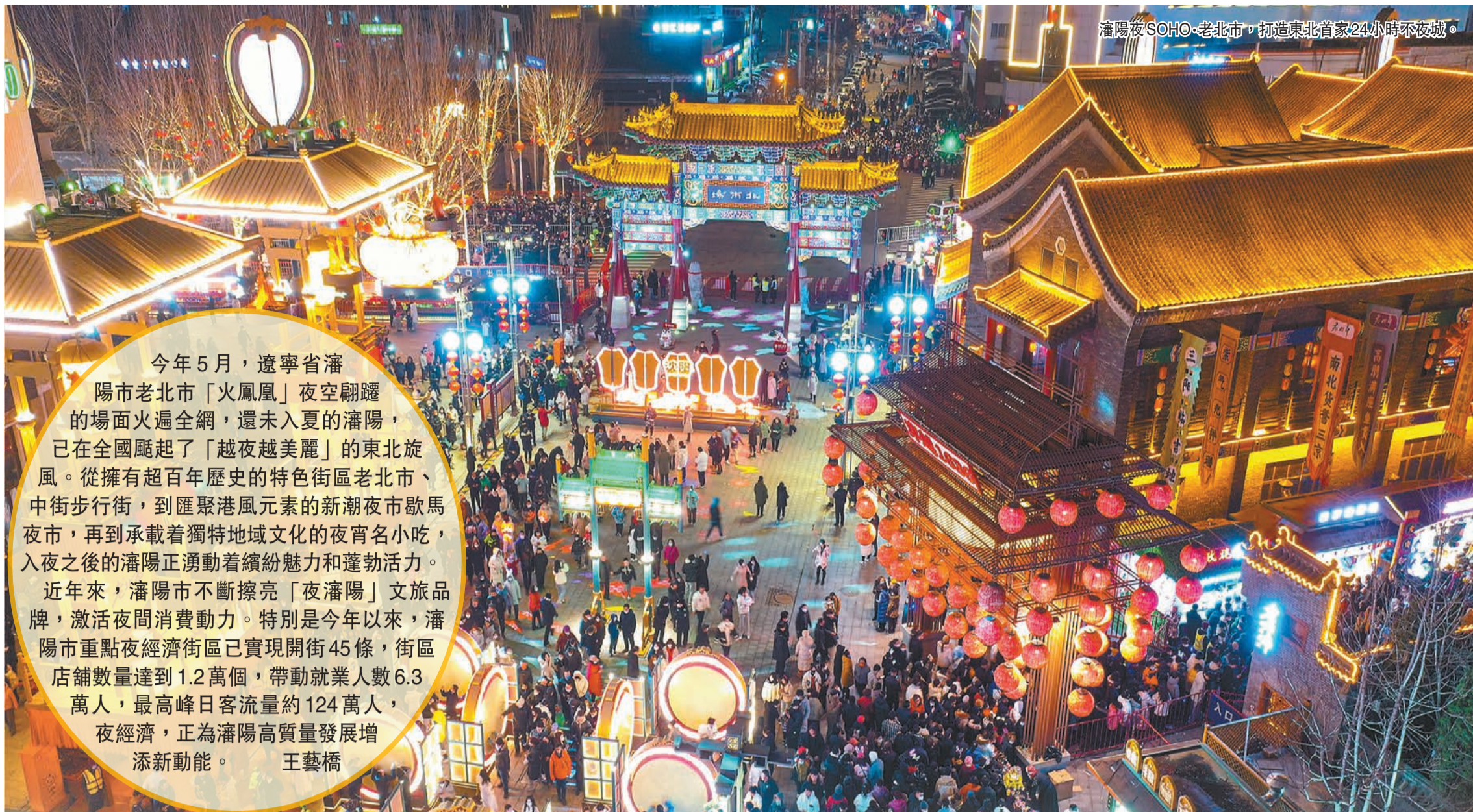
瀋陽夜SOHO·老北市，打造東北首家24小時不夜城。

今年5月，遼寧省瀋陽市老北市「火鳳凰」夜空翻騰的場面火遍全網，還未入夏的瀋陽，已在全國颯起了「越夜越美麗」的東北旋風。從擁有超百年歷史的特色街區老北市、中街步行街，到匯聚港風元素的新潮夜市歇馬夜市，再到承載着獨特地域文化的夜宵名小吃，入夜之後的瀋陽正湧動着繽紛魅力和蓬勃活力。近年來，瀋陽市不斷擦亮「夜瀋陽」文旅品牌，激活夜間消費動力。特別是今年以來，瀋陽市重點夜經濟街區已實現開街45條，街區店鋪數量達到1.2萬個，帶動就業人數6.3萬人，最高峰日客流量約124萬人，夜經濟，正為瀋陽高質量發展增添新動能。 王藝橋