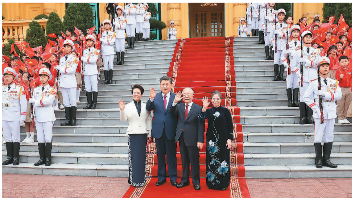
当地时间12月12日下午,刚刚抵达河内的中共中央总书记、国家主席习近平在越共中央驻地同越共中央总书记阮富仲举行会谈。这是阮富仲在主席府广场为习近平举行隆重欢迎仪式。