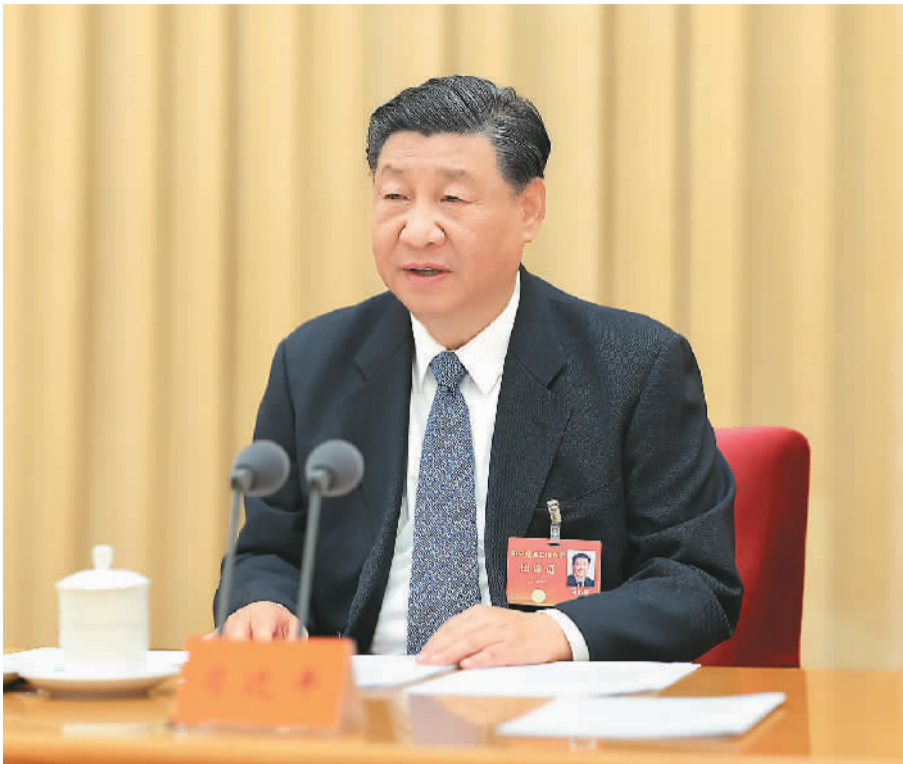
12月11日至12日,中央经济工作会议在北京举行。中共中央总书记、国家主席、中央军委主席习近平出席会议并发表重要讲话。

■做好明年经济工作,要以习近平新时代中国特色社会主义思想为指导,全面贯彻党的二十大精神,坚持稳中求进工作总基调,完整、准确、全面贯彻新发展理念,加快构建新发展格局,着力推动高质量发展,全面深化改革开放,推动高水平科技自立自强,加大宏观调控力度,统筹扩大内需和深化供给侧结构性改革,统筹新型城镇化和乡村全面振兴,统筹高质量发展和高水平安全,切实增强经济活力、防范化解风险、改善社会预期,巩固和增强经济回升向好态势,持续推动经济实现质的有效提升和量的合理增长,增进民生福祉,保持社会稳定,以中国式现代化全面推进强国建设、民族复兴伟业