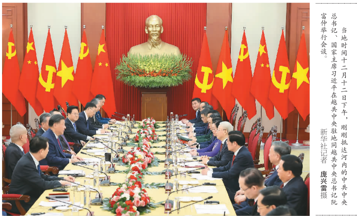
当地时间十二月十二日下午,刚刚抵达河内的中共中央总书记、国家主席习近平在越共中央驻地同越共中央总书记阮富仲举行会谈。

本报河内12月12日电(记者杜尚泽、杨学博)当地时间12月12日下午,刚刚抵达河内的中共中央总书记、国家主席习近平在越共中央驻地同越共中央总书记阮富仲举行会谈。双方宣布中越两国关系新定位,在深化中越全面战略合作伙伴关系基础上,携手构建具有战略意义的中越命运共同体。