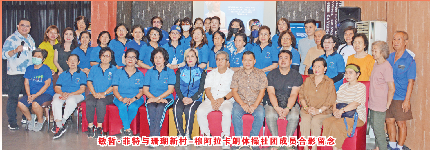
敏哲·菲特与珊瑚新村-穆阿拉卡朗体操社成员合影留念

【本报讯】2023年12月11日周一上午, 来自民主党6号的首都专区第三选区国会立法委员候选人敏哲·菲特举行一场聚会。这是敏哲·菲特