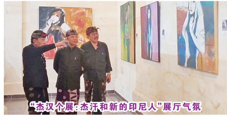
“杰汉个展: 杰汉和新的印尼人”展厅气氛