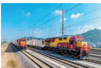
◆10月16日，中越、中老鐵路國際雙邊貨運班列從雲南省玉溪市研和站發車啟程（無人機照片）。

香港文匯報訊 據新華社報道，12月12日，廣西壯族自治區商務廳廳長楊春庭表示，廣西將探索實施中越「兩國兩園」聯動發展新模式，將邊境經濟合作區、跨境經濟合作區建設成為擴大雙向投資的重要載體，打造跨境沿邊經濟帶，促進越南等東盟國家水果輸華便利化。