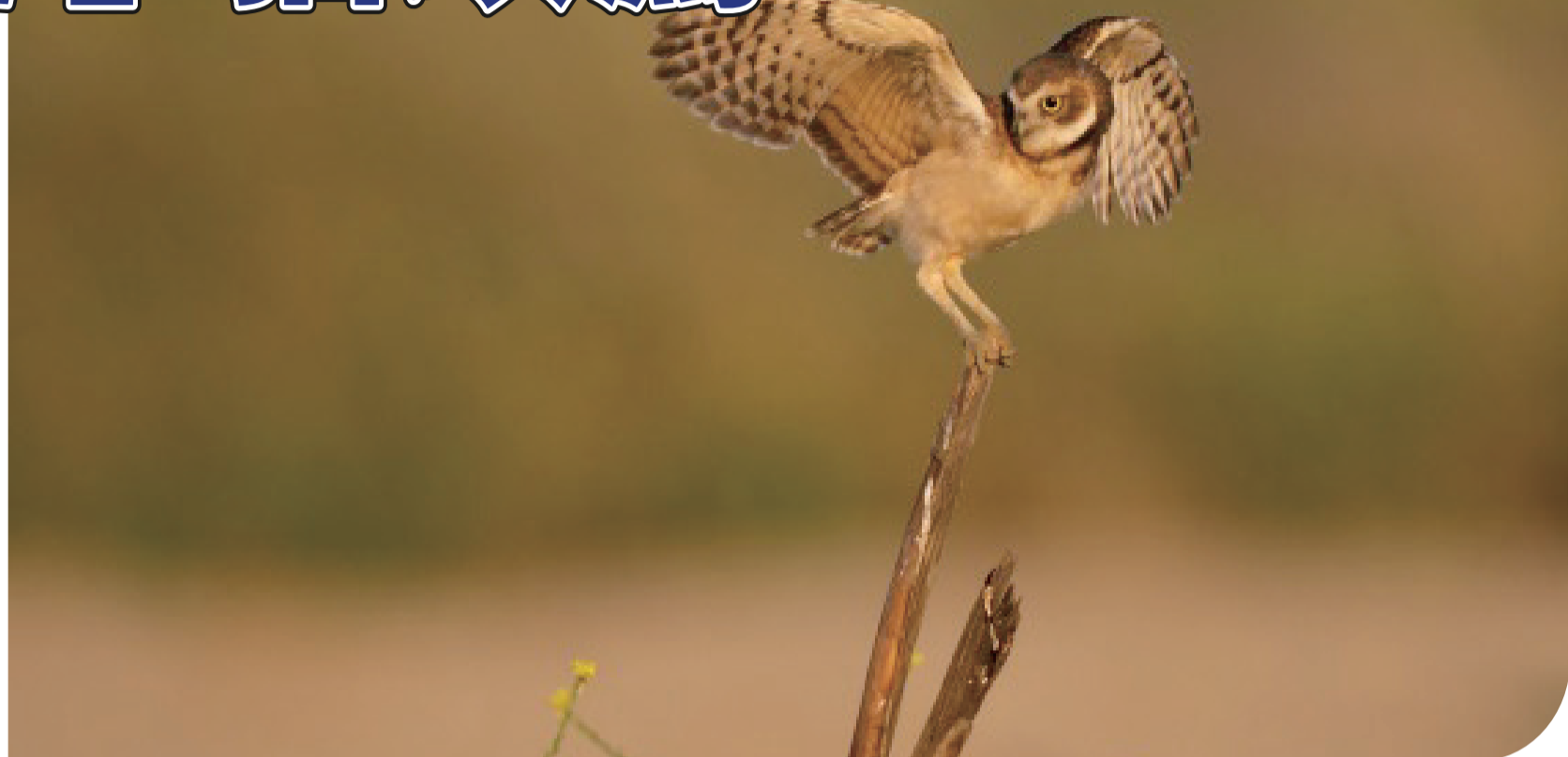
多樣，捕食對象包括昆蟲、鼠、兩栖動物、魚以及其他鳥類，甚至還會攻擊本地貓頭鷹。(楊舒怡)