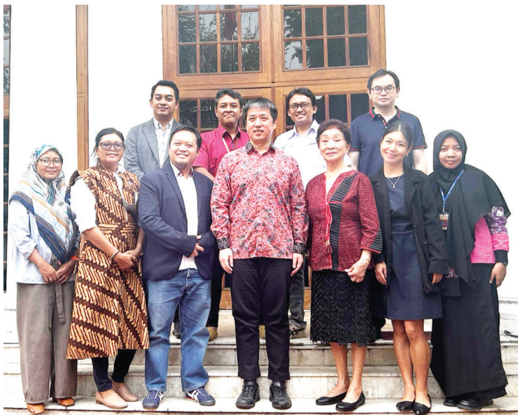
徐永总领事(前排正中)与媒体人士们合影