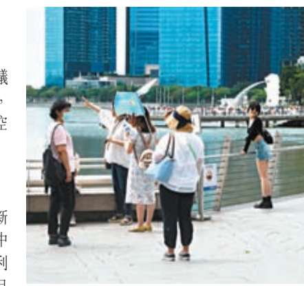
◆新加坡是中國出境旅遊熱門目的地。圖為中國遊客在新加坡濱海灣觀光。

另外，中國外交部發言人汪文斌7日回應有關新加坡將與中國建立30天互免簽證安排時表示，中新進一步加強人文交流，符合兩國人民的根本利益。雙方一致同意互免持普通護照人員簽證。目前，兩國主管部門正就具體事宜進行密切溝通，中新雙方共同期待有關安排早日落地生效。