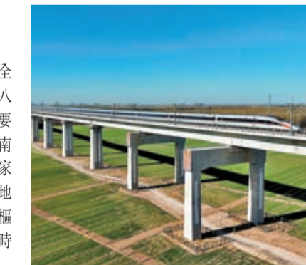
◆列車跨過濟鄭高鐵長清黃河特大桥。

「高鐵線的開通會讓兩地民眾在心理上形成親近感，產生「抱團式」的向心力。」東亞智庫首