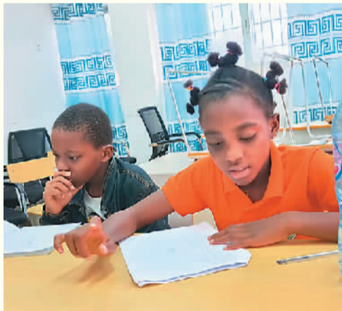
阿碧（右）在学习中文。