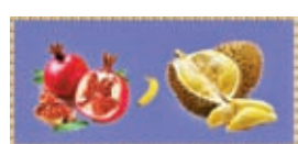
應時水果特別鮮亮。

客會不會擔心吃羊腩煲可能補出鼻血。 飲食看天時，俗語有說「不時不食」，有個嗜魚前輩常對人說，他幾十年吃魚經驗，就是完全信服那句口訣：「春鱸夏鮫，秋鯉冬鮫」意思是春天塘魚肉鮮，夏天鮫魚味爽，秋天鯉魚清甜，冬天鮫魚膠質多，最宜做魚滑。 可是近年碰上秋冬多行春夏令，改變了魚的生態，魚的情緒也不好，肉質也有了改變，唯一妙在塘魚春享到夏，味道才差不過鮫魚，只知秋風吹不到鯉魚塘，鯉魚是否甜美了；冬天鮫魚球必然沒有天氣正常時好滋味吧。 蔬果亦然，俗說冬天蘿蔔夏天薑，都是補身妙品，如今冬行夏令，講究進補，該吃蘿蔔還是薑？ 蔬果當然也受時令影響，根據前人經驗，往往是不同季節吃不同蔬菜，一旦不依時令，本來季節性應吃的蔬果，也會失去原有的清香，當吃到果肉微硬不軟的香蕉，筋多味淡的菜心，還不是非時令產品？