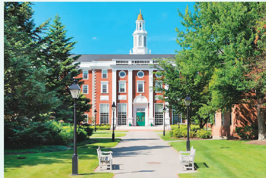
美国哈佛大学校园景色。

除此之外，部分美国公立院校由于申请人数众多，也会采取滚动录取(Rolling Admission, 简称RA)这种招生方式，即院校只要没有招满，学生可以持续递交申请。这种申请方式也常见于英国、澳大利亚、新西兰等英联邦国家和地区高校。