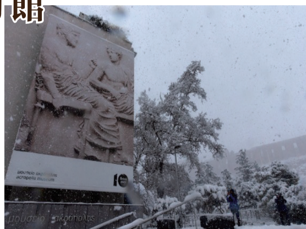
在這次展覽揭幕前,英國與希臘剛剛發生

借過。雅典衛城博物館從12月4日到明年4月14日舉辦名為「意義」的主題展覽,展品除這個陶罐,還有意大利佛羅倫薩考古博物館出借的銅雕「阿雷佐的喀邁拉」以及西班牙普拉多博物館出借的巴洛克風格代表人物魯本斯的畫作。「阿雷佐的喀邁拉」製於公元前400年前後,被視為意大利中西部古代城邦國家伊特魯里亞最著名的藝術品之一。