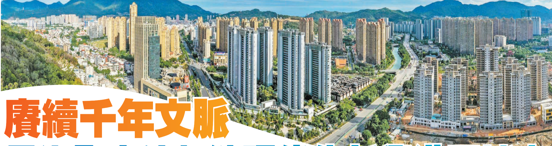
長樂市區全景圖。