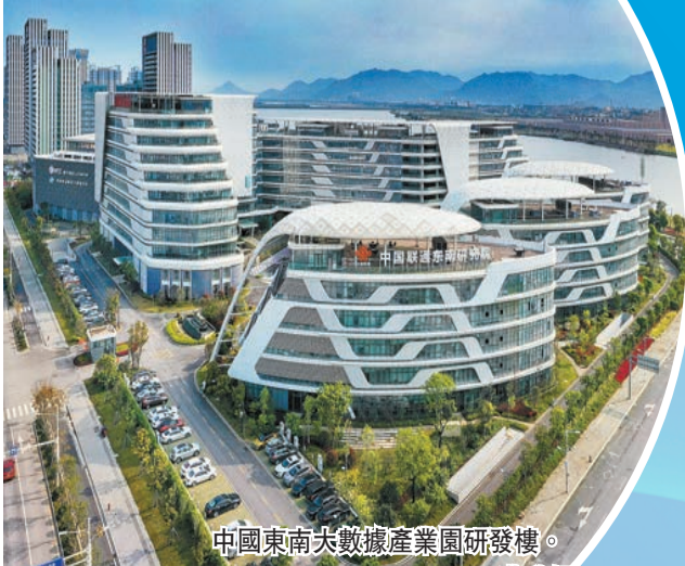
中國東南大數據產業園研發樓。