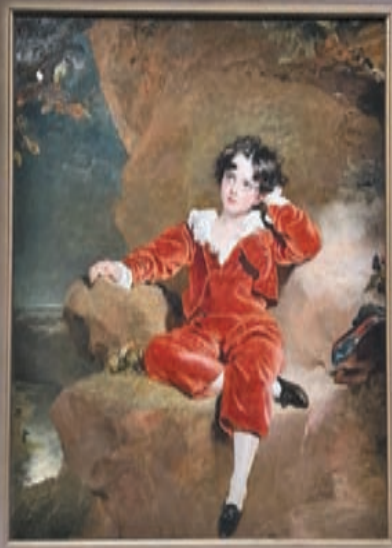
湯姆士·羅蘭士作品《查理斯·威廉·蘭姆頓肖像》，1825年。

文藝復興、印象派與後印象派流行之時，是西方藝術史上極具影響力的時期，孕育出梵高、莫奈等傳奇畫家，奠定了現代藝術的基礎，並發展出後世多元的藝術風格。香港故宮文化博物館即日起舉辦「從波提切利到梵高：英國國家美術館珍藏展」，展出52幅十五至二十世紀的名家名作，包括梵高、波提切利的畫作，讓觀者從中了解西方藝術史上最重要時期的作品。