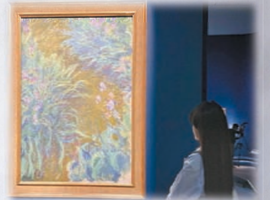
莫奈作品《鸚尾花》，約1914至1917年。

日期：即日起至2024年4月11日 時間：星期一、三、四、日上午10時至下午6時；星期五、六及公眾假期上午10時至晚上8時；星期二（公眾假期除外）、農曆年初一及年初二休館 地點：香港故宮文化博物館展廳9 票價：HK$150（成人門票）、HK$75（特惠門票）