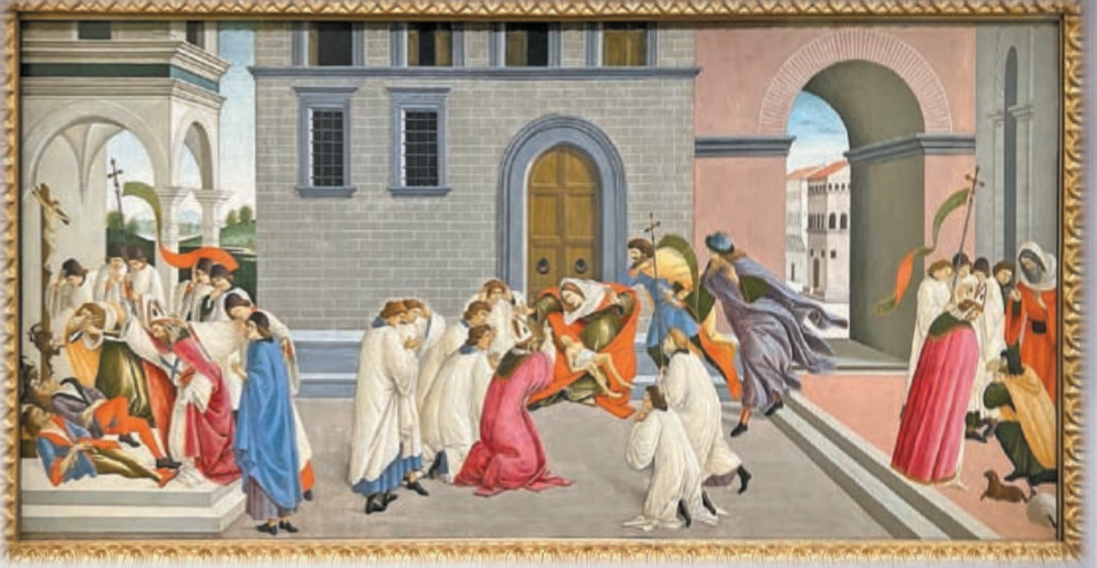
波提切利作品《聖芝諾比烏斯的三個奇蹟》，約1500年。