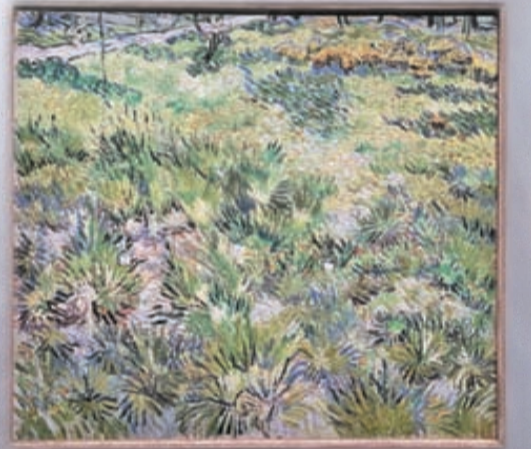
梵高作品《長草地與蝴蝶》，1890年。