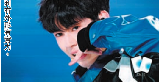
奧利有外形有實力。