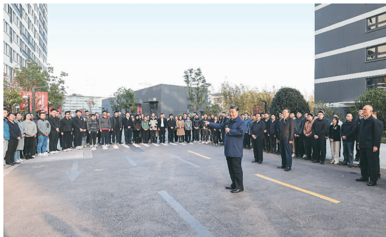
11月28日至12月2日,中共中央总书记、国家主席、中央军委主席习近平在上海考察。这是11月29日下午,习近平在闵行区新时代城市建设者管理者之家,同社区居民亲切交流。

本报上海/江苏盐城12月3日电 中共中央总书记、国家主席、中央军委主席习近平近日在上海考察时强调,上海要完整、准确、全面贯彻新发展理念,围绕推动高质量发展、构建新发展格局,聚焦建设国际经济中心、金融中心、贸易中心、航运中心、科技创新中心的重要使命,以科技创新为引领,以改革开放为动力,以国家重大战略为牵引,以城市治理现代化为保障,勇于开拓、积极作为,加快建成具有世界影响力的社会主义现代化国际大都市,在推进中国式现代化中充分发挥龙头带动和示范引领作用。