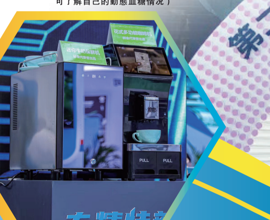
(全自動化咖啡機可以為自己量身定制一杯風味香濃的咖啡)