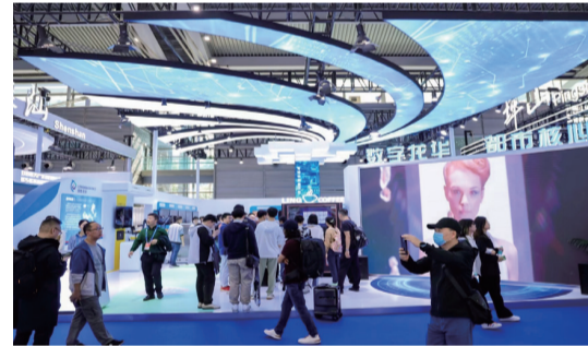
(龍華展區: 造型模擬“高鐵軌道”, 未來感、科技感十足)