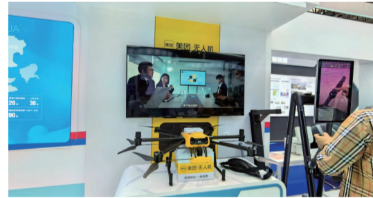
(可提供標準配送服務的美團無人機)