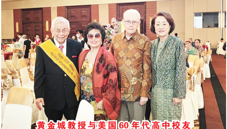
黄金城教授与美国60年代高中校友