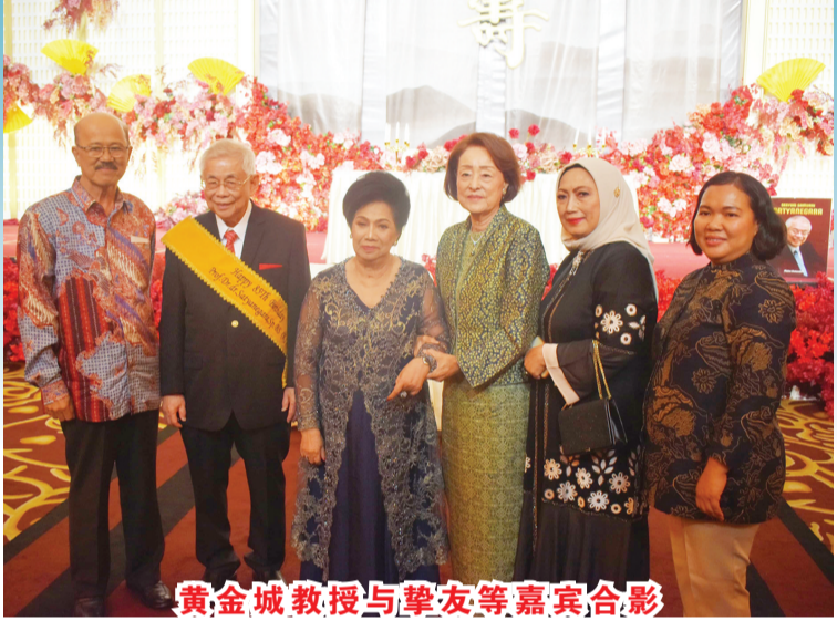
黄金城教授与挚友等嘉宾合影

500张照片，我把重要的照片一一挑选出来。我还拍摄了新照片，以及收集手机中的照片，放在《微笑武士 Satyanegara》一书中。” 他指出，“我的第11本书《微笑武士 Satyanegara》出版，目的是为了展示我的能力。至少，我不应该被随意低估。1970年至1980年期间，我的工作效率非常高。第11本书在梅塔·乌兰达里的协助下，安排了原本可能是我规划的文字，变成了不同的写作模式，有些词语惯用爪哇语，使书变得更加通俗与幽默感。”