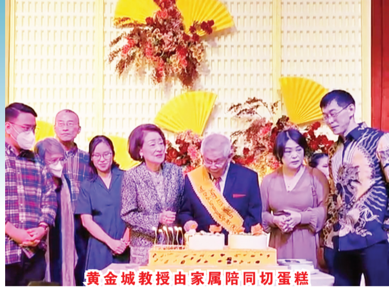
黄金城教授由家属陪同切蛋糕

【本报讯】2023年12月2日晚6时，著名脑神经解剖专家黄金城医生博士、教授85岁诞辰庆典在雅加达太阳城酒楼举行，百多祝寿花牌林立摆在酒楼前。各医院领导、医生护士、知名人士及亲朋好友近千人士出席盛会。会上，切生日蛋糕及发布新书《微笑武士 Satyanegara》。 黄金城教授说：“我今年已85岁了，其实我没有打算举办这生日会，而是想一个人静静地在一处庆祝，这样我可以放松自己。我不想打扰很多人。但到了2023年5月，筹委会和我内人已经在静悄悄地忙着准备这次85岁庆典。”