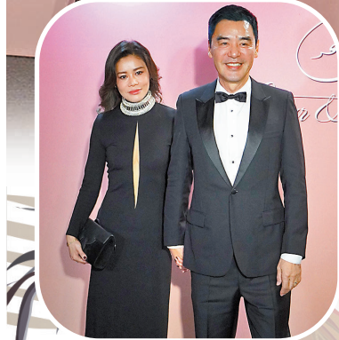
鍾鎮濤與性感打扮的太太拖手現身。