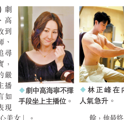
林正峰在內地人氣急升。

香港文匯報訊（記者達里）劇集《新聞女王》講到余詩曼、高海寧、何依婷和馬國明等人收到富商離世消息後，分別循律師、家庭醫生及茶客等不同方向追尋線索，雖有把握富商死訊屬實，但有人卻不想負上錯誤報道的嚴重後果。結果高海寧飾演的直播許詩晴於危急關頭自薦，直言如報道錯誤就由她一人負責，表現贏得一致好評，更獲封為「野心美女」。