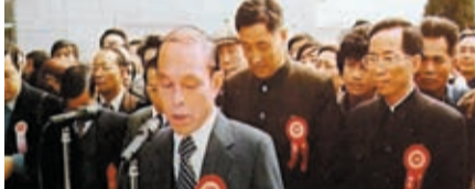
◆1979年12月28日，霍英東在中山溫泉賓館開業典禮上致詞。

2003年2月6日，白天鵝賓館合作期滿，此時賓館資產已逾20億元人民幣。霍英東毅然履行承諾，毫無條件地將賓館全部交給廣東省政府。「愛國、報國，始終是霍英東先生的本心。」林鎮海很是感觸。「白天鵝賓館就像一扇窗戶，讓普通老百姓看到了改革開放帶來的美好生活圖景，凸顯廣州包容開放的精神；而中國開放、友好、發展、和平的理念，也通過白天鵝賓館這扇窗戶，向世界傳遞了出去。」