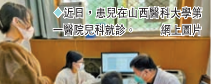
◆近日，患兒在山西醫科大學第一醫院兒科就診。

科、呼吸科的人員配置，通過加開診室、延長門診時間、開設夜間門診和周末門診，提供「互聯網+」診療服務等方式，擴大醫療服務供給，最大限度滿足兒童的就醫需求。