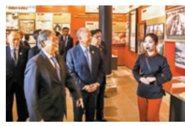
◆霍英東紀念館舉辦題為「拳拳赤子心，殷殷桑梓情」的霍英東生平事跡展。圖為嘉賓在參觀展覽。

香港文匯報訊（記者 盧靜怡、李紫妍廣州報道）2日，隨着紅綢布徐徐揭開，位於廣州南沙的霍英東紀念館正式開館。今年正值霍英東先生誕辰100周年，為了弘揚其矢志愛國、傾心為港、竭誠愛鄉、擔當奉獻的精神，紀念其立足香港、胸懷祖國、敢為人先、勇於拚搏的傳奇一生，霍英東紀念館舉辦了題為「拳拳赤子心，殷殷桑梓情」的霍英東生平事跡展。該館正式亮相，為廣州南沙增添了一處具有重要歷史和文化意義的新地標。霍英東集團主席霍震霆在開館儀式上表示，霍英東紀念館將積極發揮其社會教育功能，為廣大民眾尤其是青年朋友提供一個學習、傳承霍英東精神的寶貴平台。