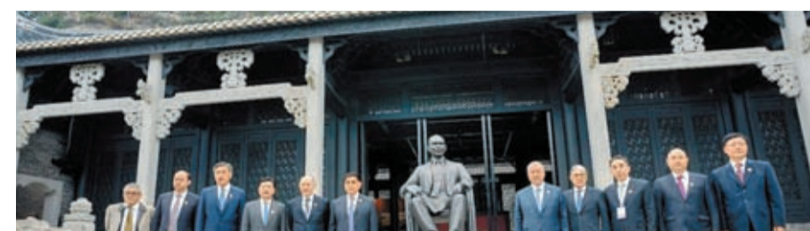
◆2日，霍英東紀念館正式在南沙開館。