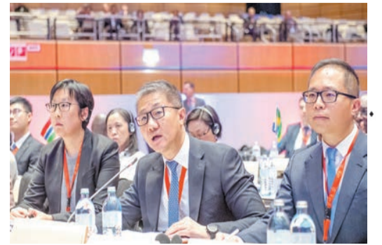
警務處處長蕭澤頤(中)出席奧地利維也納舉行的國際刑警組織全體大會。

【香港商報訊】記者萬家成報道：警務處處長蕭澤頤率領一行十人的香港代表團，跟隨公安部副部長徐大彤所帶領的國家代表團，出席11月28日至12月1日期間在奧地利維也納舉行的第91屆國際刑警組織全體大會。據了解，全體大會是國際刑警組織的最高權力機關，在每年一度的會議中，議決各項重要政策。今年有來自160個國家，超過1000名高級警務人員出席。