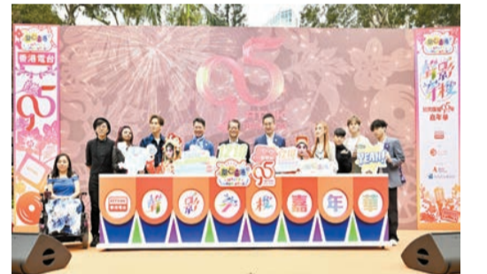
一眾嘉賓為「開心香港—聲影穿梭—香港公共廣播95年」嘉年華主持開幕。

【香港商報訊】記者馮仁榮報道：香港電台昨日於香港科學館露天廣場舉行為期兩天的「開心香港—聲影穿梭—香港公共廣播95年」嘉年華，透過多個主題攤位、文娛表演及多媒體展覽，慶祝香港公共廣播邁向新里程。