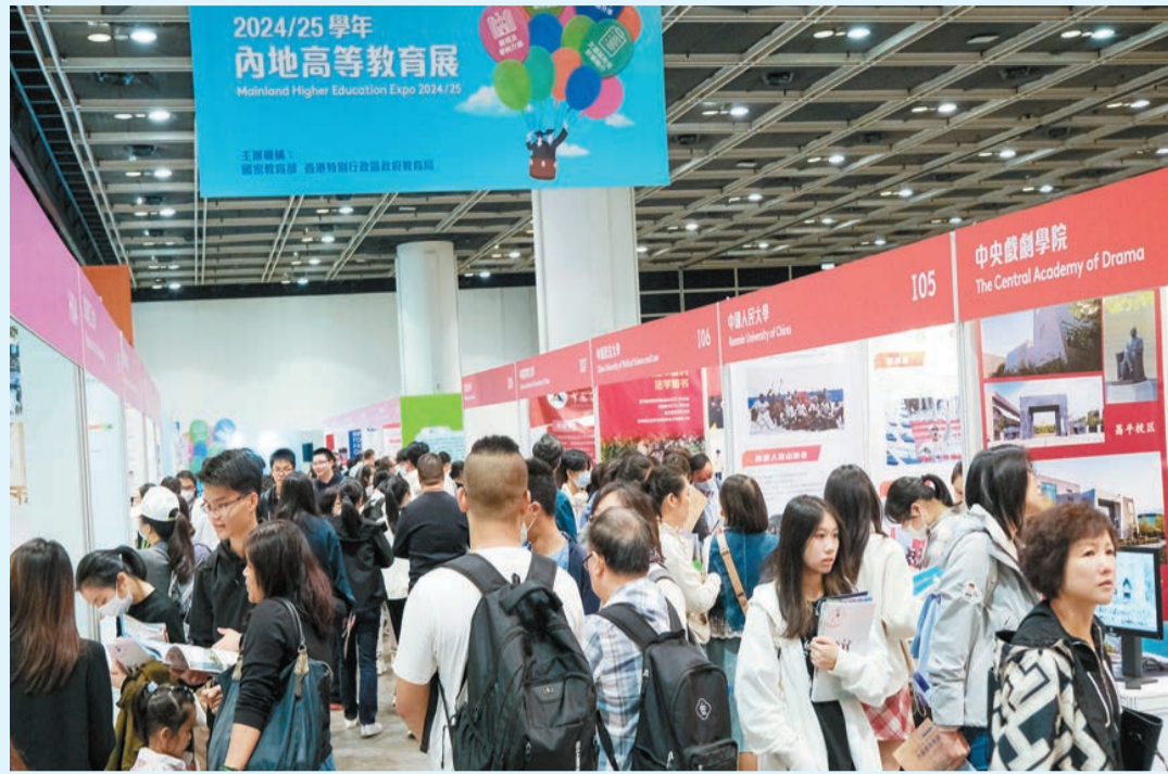
2024/25學年內地高等教育展昨起一連兩天在港舉行，吸引大批家長及學生進場。

【香港商報訊】記者周偉立報道：由國家教育部和香港教育局聯合舉辦的2024/25學年內地高等教育展昨日起一連兩天在本港舉行，為有意赴內地升學的學生和家長，介紹該學年內地高校招收香港中學文憑考試學生計劃（文憑試收生計劃）的各項安排及相關升學資訊。教育局局長蔡若蓮昨日在開幕禮致辭表示，文憑試收生計劃多年來取得良好成果，至今有超過42000名香港學生通過計劃報考內地高校。2024/25學年參與計劃的院校數目將增加至138所，為學生提供更多元、更適合自己的選擇。