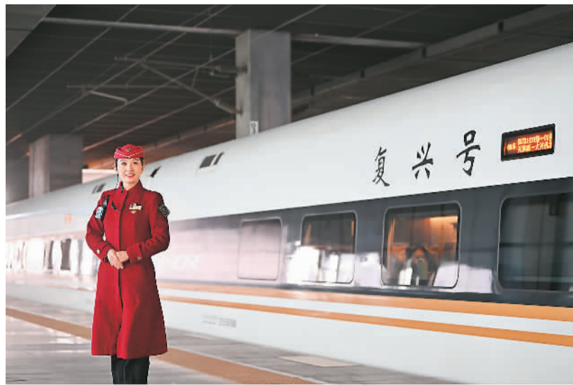
津兴城际铁路预计将于年内正式通车，通车后将进一步完善北京大兴国际机场集疏运网络，助力打造“轨道上的京津冀”。图为近日，列车长在运行试验车前演练候车。

本次大会达成意向签约项目152个，意向投资额超千亿元，发布了“五群六链五廊”的京津冀