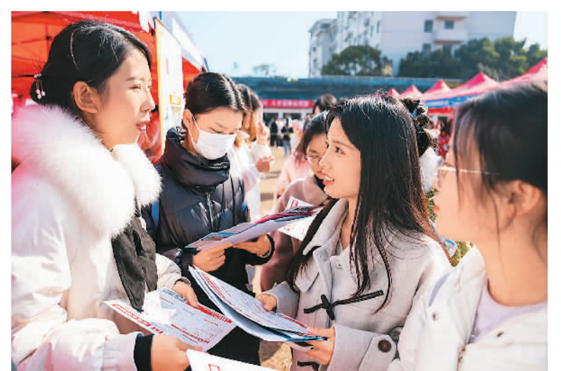
12月1日，湖南省2024届高校毕业生就业专场招聘会在湖南师范大学体育场举办，吸引全国300余家用人单位，数千名学生参与。图为企业招聘人员(左一)向求职学生介绍岗位信息。

养社区、6个旅居疗养社区和4个居家安养照护中心，提供形式多样的差异化养老服务，并探索养老产业与保险的融合发展，打造“保险保障+养老服务”生态链，围绕完善养老保障、康养业态布局、养老服务能力建设等开展创新实践。截至今年10月底，大家保险在京开业运营的朝阳和友谊城社区入住率分别达到95%和85%。