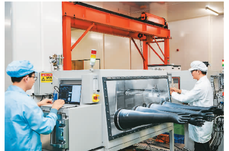
近年来，重庆市北碚区与中国铁建携手共建重庆市传感器产业园，通过出台专项激励措施、设立产业扶持基金等举措，推动智能传感器产业规模化、特色化、差异化、高端化发展。目前，该产业园已集聚传感器产业相关企业34家。图为11月30日，该产业园中科光智(重庆)科技有限公司工作人员在生产测试车间作业。

旅行服务快速恢复。1至10月，旅行服务进出口11833.6亿元，同比增长71.7%，继续保持为增长最快的服务贸易领域。其中，出口同比增长53.8%，进口同比增长73.2%。