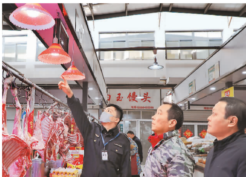
连日来，安徽省六安市市场监管部门组织工作人员以农贸市场、大型商超及生鲜肉店、水果店铺等经营场所为重点，对肉类、熟食、水果等产品使用光源进行专项检查和宣传引导，督促相关商户逐步更换符合要求的照明设施，切实保障食品安全，维护消费者合法权益。

对“生鲜灯”误导消费的反映由来已久。“北京市天元律师事务所合伙人李均皓表示。江西省消保委今年11月发布的《江西食用农产品销售市场“生鲜灯”使用状况调查报告》显示，265家经营场所中，超过八成使用了“生鲜灯”照明，超过