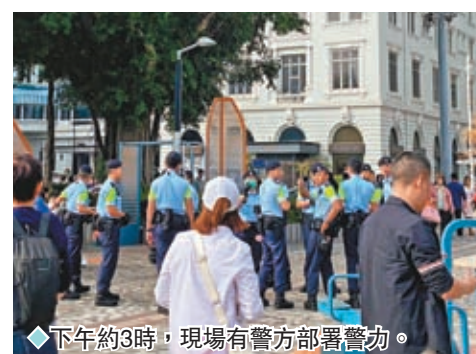
◆下午約3時，現場有警方部署警力。