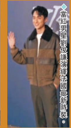
◆當紅男星劉以豪演法國最新時裝。

香港文匯報訊（記者 梁靜儀、吳文釗）國際品牌 Louis Vuitton (LV) 2024 初秋男裝系列時裝秀，11月30日晚於尖沙咀星光大道舉行，雲集80位中外名人紅星行秀，示範最新款時裝。