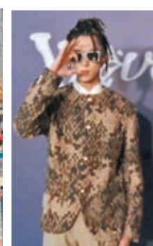
◆王鶴棣麟辦造型登場。