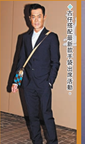
◆古仔搭配最新款手袋出席活動。