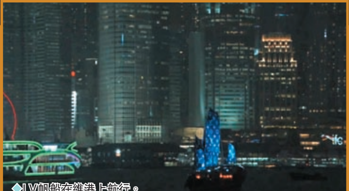
◆LV帆船在維港上航行。