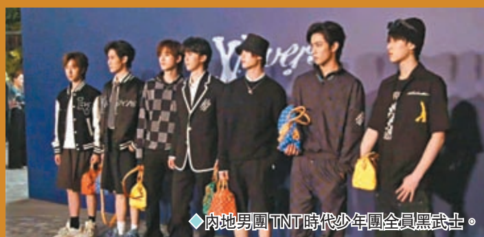
◆內地男團TNT時代少年團全員黑武士。