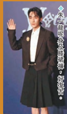
◆朱一龍呢身及膝襪褲，好復古。