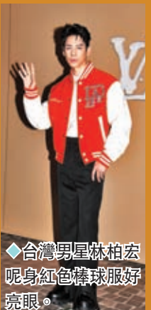
◆台灣男星林柏宏呢身紅色襪球服好亮眼。