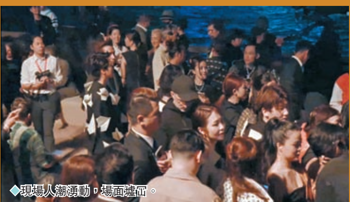
◆現場人潮湧動，場面喧嘩。