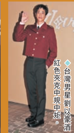
◆台灣男星劉以豪酒紅色夾克中規中矩。