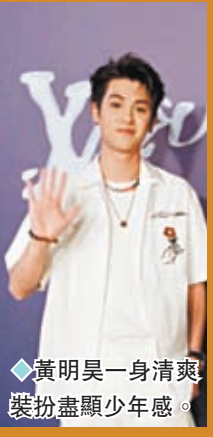
◆黃明昊一身清爽裝扮盡顯少年感。