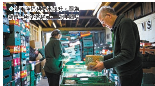
諾丁漢福利支出暴升。圖為該市一所食物銀行。網上圖片

《衛報》指出,諾丁漢面對的財政問題,包括保障兒童的成本大增、為大量無家者提供臨時住所的開支大漲,成人社會福利支出同樣暴升。諾丁漢市議會去年已出現財政困難,僅依靠動用儲備填補預算缺口。今年儘管已削減更多支出,但預計