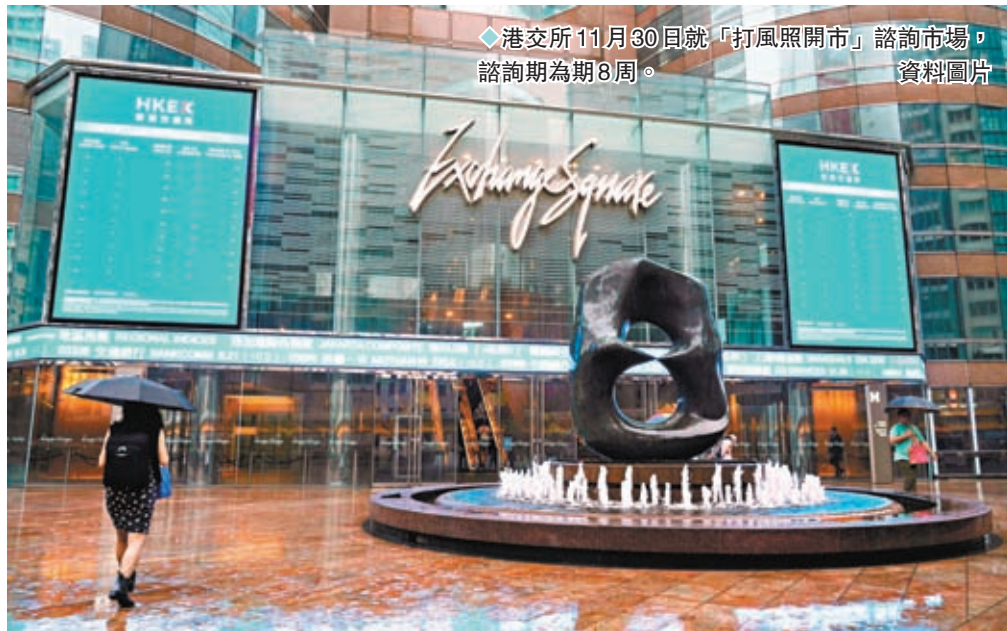
◆港交所11月30日就「打風照開市」諮詢市場，諮詢期為期8周。