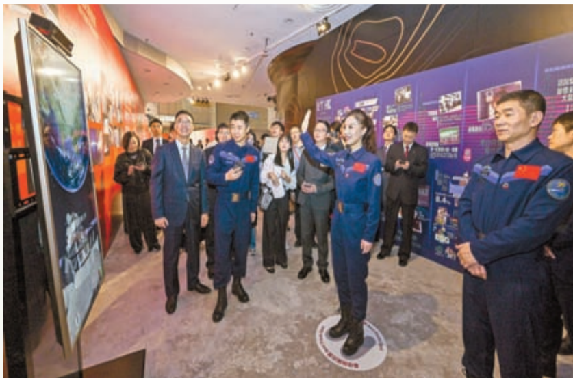
神舟十三號乘組航天员王亞平（前排右二）體驗「中國載人航天工程展」的互動展品。

昨天中午，航天團出席由創科工業局舉辦的午宴，林西強向本港科技及高等教育界代表分享了國家航天科技領域的成就和最新發展。