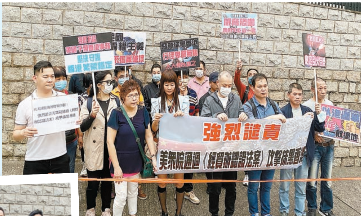
昨午，多個團體到美駐港澳總領事館抗議。

【香港商報訊】記者戴合聲、李銘欣報導：特區政府昨日強烈譴責美國眾議院外交事務委員會通過所謂「香港經濟貿易辦事處認證法案」，完全漠視香港特區在「一國兩制」下的地位，惡意污蔑實施香港國安法的正當和合法目的，詆毀香港特區政府正當依法保障人權和法治的事實，粗暴干預香港事務。美方政客的倒行逆施亦引發本港各界紛紛抗議和撻伐。