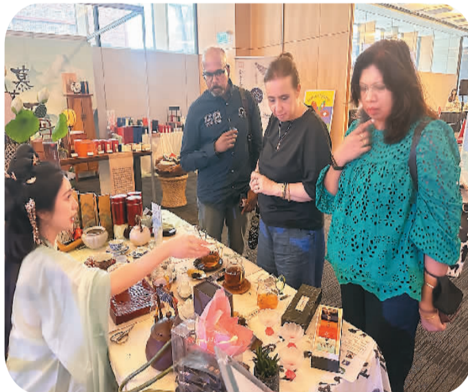
澳大利亚民众在活动现场观看中国茶艺表演。