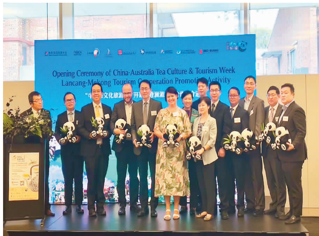
参加“中澳茶文化旅游周”暨“共饮一江水，亲如一家人”澜湄旅游合作推介活动的嘉宾合影。