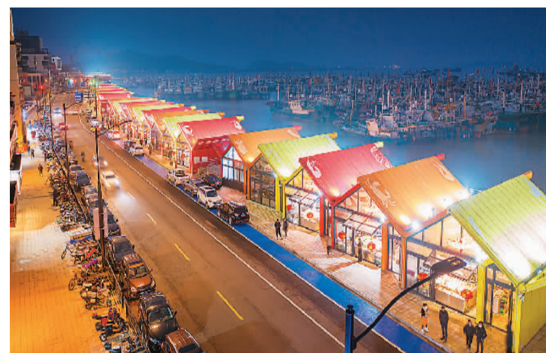
浙江省舟山市普陀区沈家门渔港。