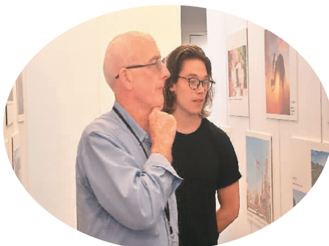
嘉宾参观“连通中国——发现澜湄之美”图片展。

澜沧江发源于中国青藏高原，出境后被称为湄公河，流经中国、缅甸、老挝、泰国、柬埔寨、越南六个国家，自古以来就是流域各国赖以生存的自然馈赠和守望相助的天然纽带，是各国经贸旅游、友好交往的“黄金水道”。自2016年澜湄合作机制启动以来，各国合作领域持续拓展，不断弘扬“平等相待、真诚互助、亲如一家”的澜湄文化，树立区域合作的“金色样板”，在亚太地区发挥着重要作用。本着命运与共的共同立场，此次活动是澜湄合作机制启动7年以来，由澜湄六国首次联合起来面向第三国国家进行的旅游推介，具有开创性意义，旨在推动中国各省份与湄公河国家“一程多站式”旅游服务和产品开发，展现澜湄多样化城市魅力，吸引澳大利亚游客到澜