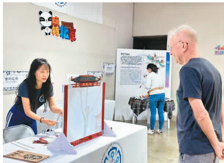
“汉字嘉年华”展览在洛杉矶开展,图为展览现场。

当展览来到洛杉矶,“你好·汉字”部分同样吸引了不少观众驻足——有的观看“汉字简史”视频,感受汉字字形之美;有的以游戏方式“挑战”古老的甲骨文,将甲骨文方块与图画中对应的部分配